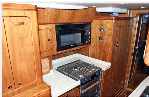
Galley Stove and Oven