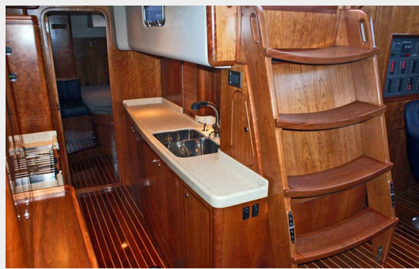
Galley and Companionway