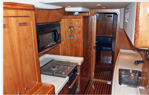
Galley, Looking Aft