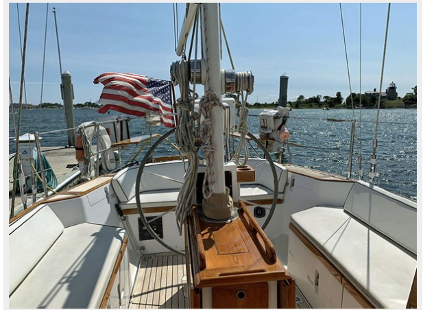
Cockpit, Looking Aft