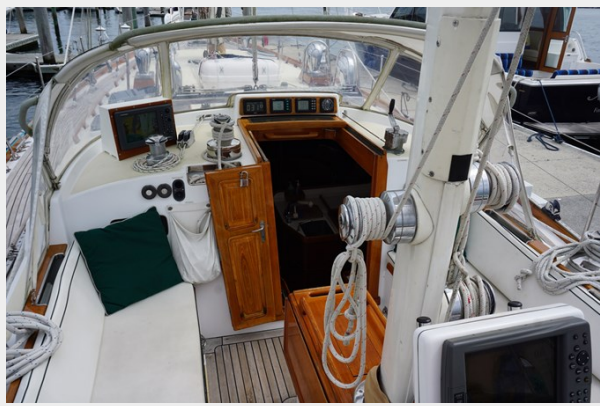
Companionway Dodger, Cockpit Electronics