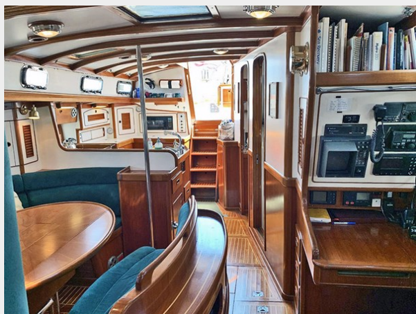
Salon, Looking Aft