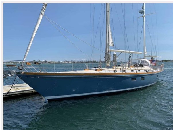
Port Bow Qtr