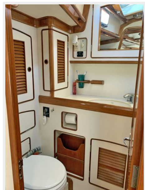
Owner's Head and Shower