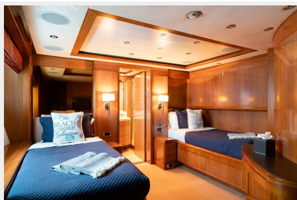
Sundeck Fwd Lounge 11_15_20_0490 (1)