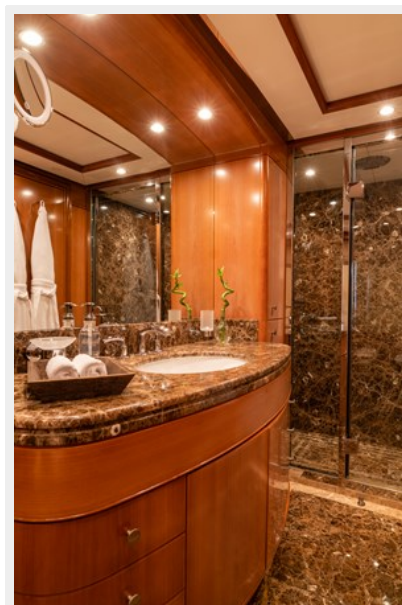
VIP Bath 11_14_20_0255 (1)