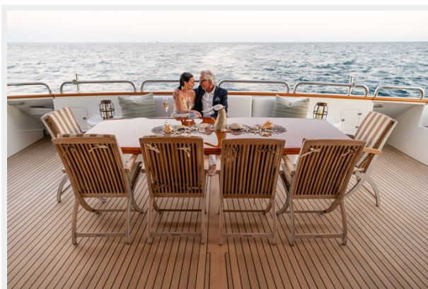
Aft Main Deck Dining 11_15_20_1048 (1)