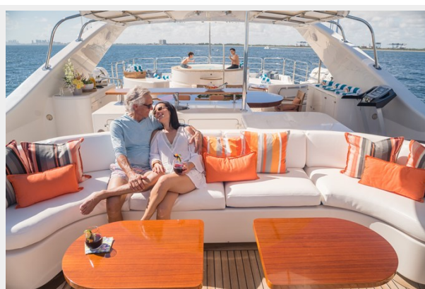
Sundeck Fwd Lounge 11_15_20_0490 (1)