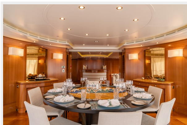
Main Dining Bridge Deck 11_14_20_0307 (1)