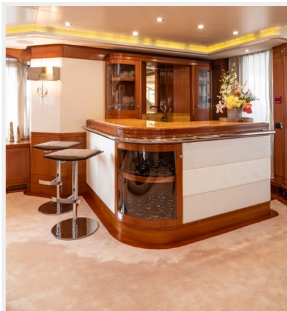
Main Salon Bar 11_14_20_0016 (1)