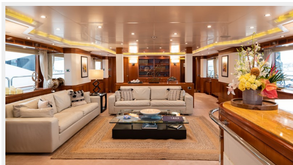
Main Salon 11_14_20_0009 (2)