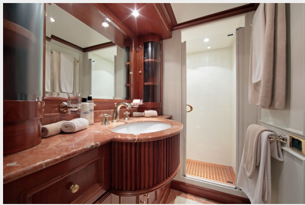
Lower Deck Cabin