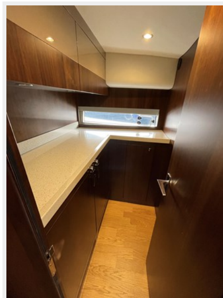
Galley - Fridge