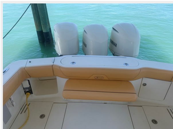
26_2014 35ft Scout 350 LXF SAND DOLLAR TOO