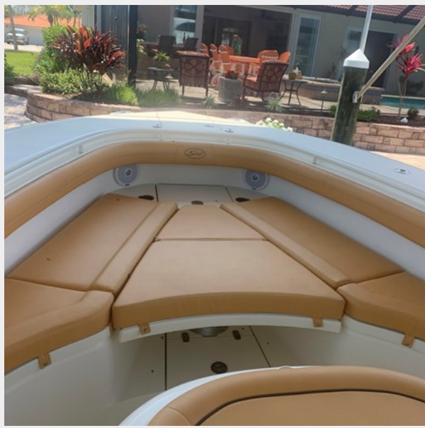
6_2014 35ft Scout 350 LXF SAND DOLLAR TOO