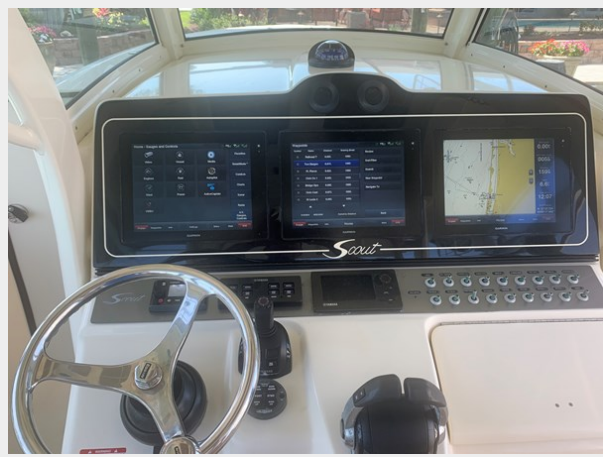
16_2014 35ft Scout 350 LXF SAND DOLLAR TOO