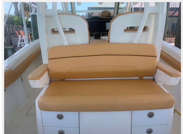
23_2014 35ft Scout 350 LXF SAND DOLLAR TOO