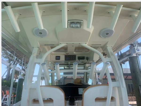
22_2014 35ft Scout 350 LXF SAND DOLLAR TOO