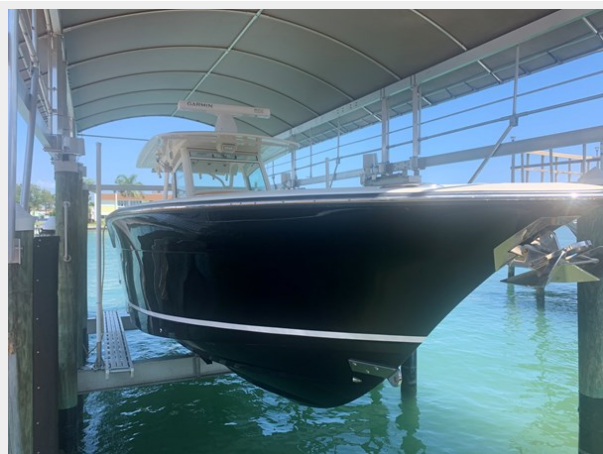
2_2014 35ft Scout 350 LXF SAND DOLLAR TOO