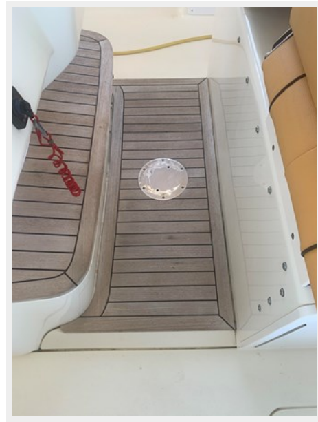
15_2014 35ft Scout 350 LXF SAND DOLLAR TOO