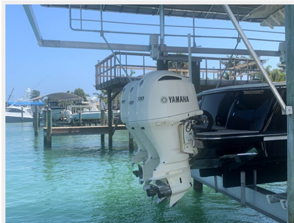
3_2014 35ft Scout 350 LXF SAND DOLLAR TOO