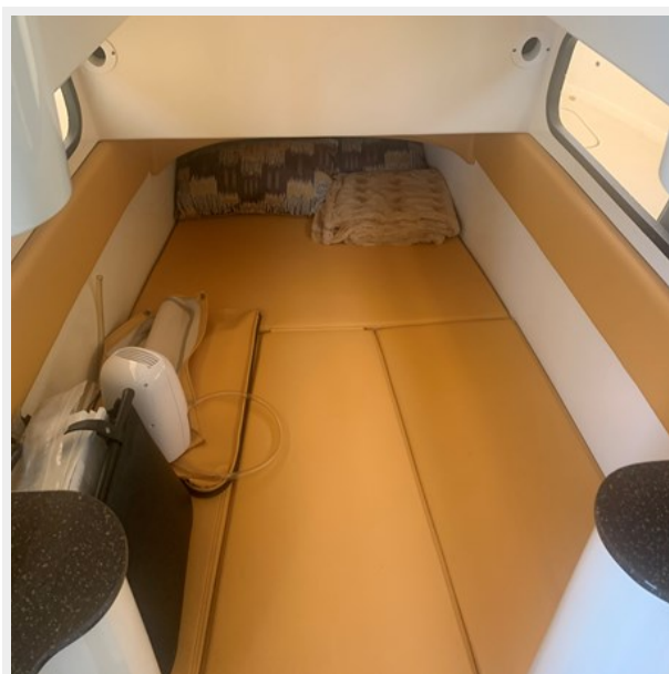
28_2014 35ft Scout 350 LXF SAND DOLLAR TOO