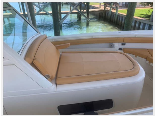
11_2014 35ft Scout 350 LXF SAND DOLLAR TOO