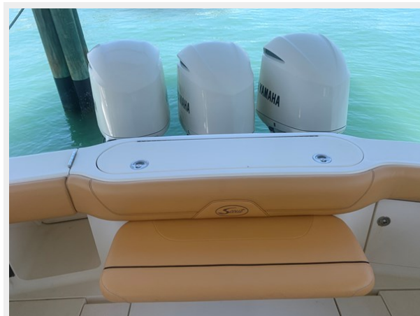
27_2014 35ft Scout 350 LXF SAND DOLLAR TOO