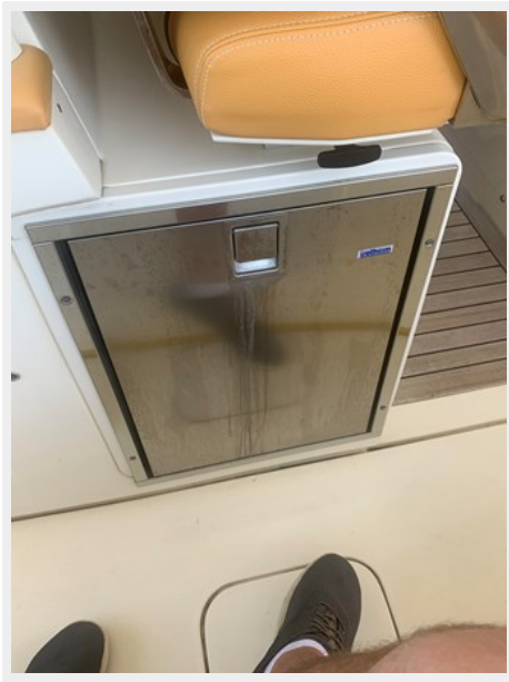
14_2014 35ft Scout 350 LXF SAND DOLLAR TOO