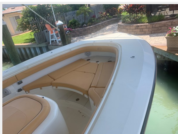
4_2014 35ft Scout 350 LXF SAND DOLLAR TOO