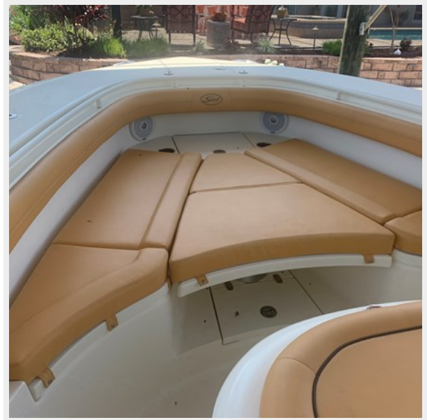
7_2014 35ft Scout 350 LXF SAND DOLLAR TOO