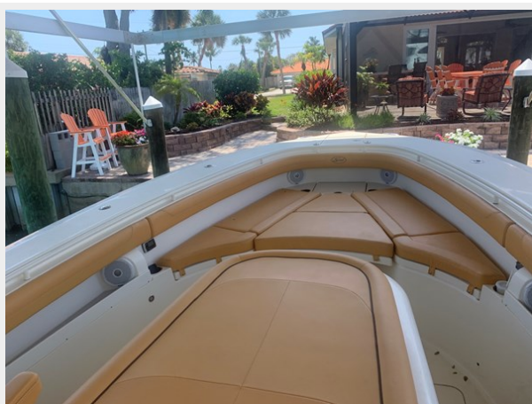
8_2014 35ft Scout 350 LXF SAND DOLLAR TOO