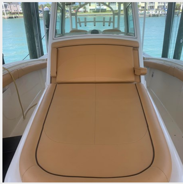
10_2014 35ft Scout 350 LXF SAND DOLLAR TOO