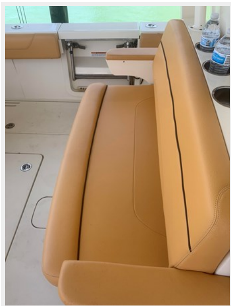
24_2014 35ft Scout 350 LXF SAND DOLLAR TOO