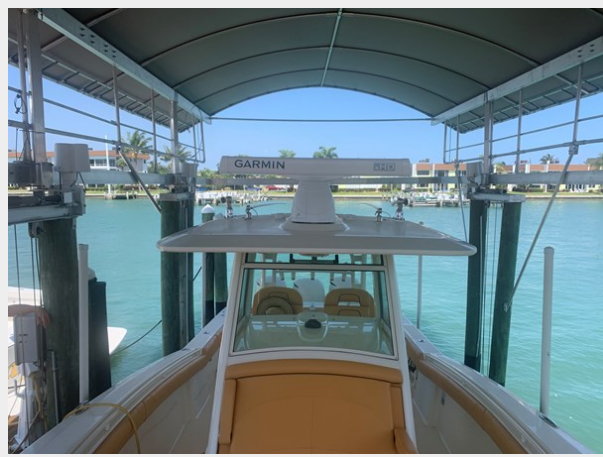
12_2014 35ft Scout 350 LXF SAND DOLLAR TOO