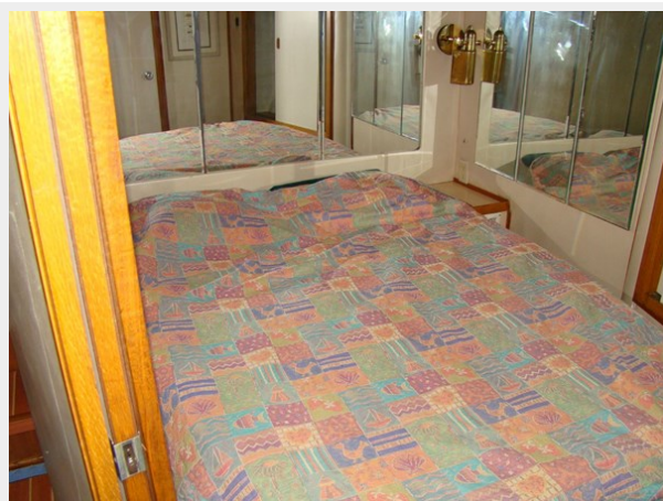
25. Guest Sateroom