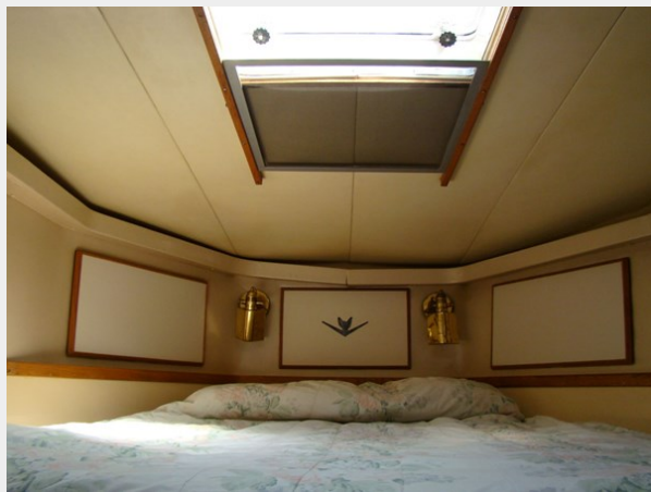
23. Master Ceiling