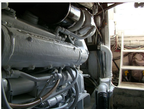
34. Starboard Main