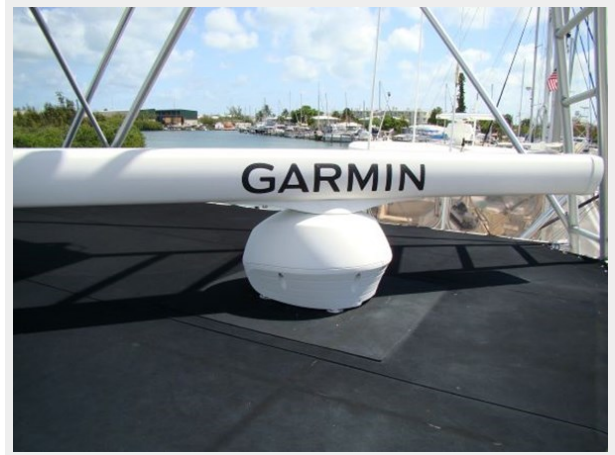
44. Open Array