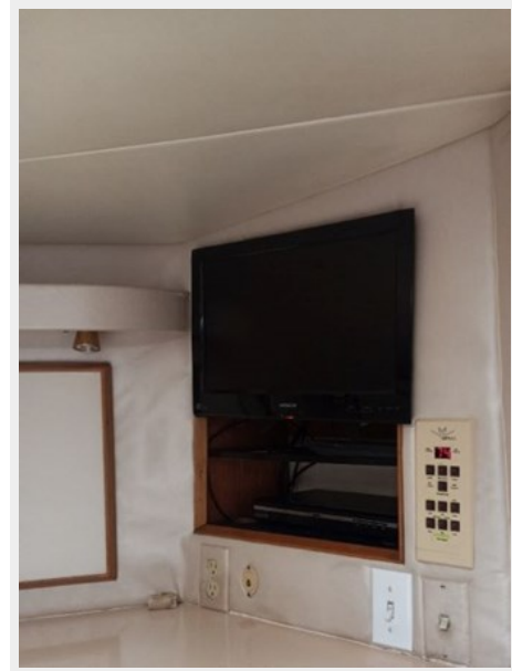
24. Master Entertainment Center