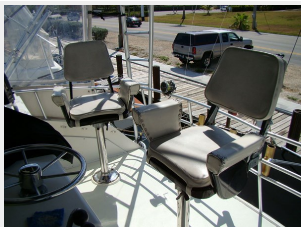
45. Fly Bridge Seating