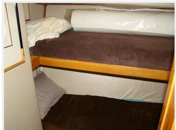
26. Crew Cabin