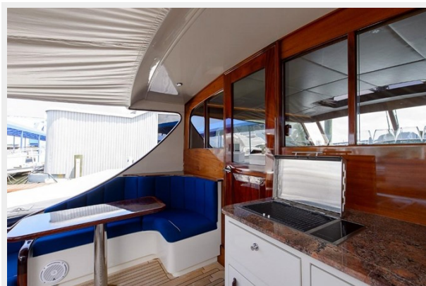
Cockpit cabin bulkhead