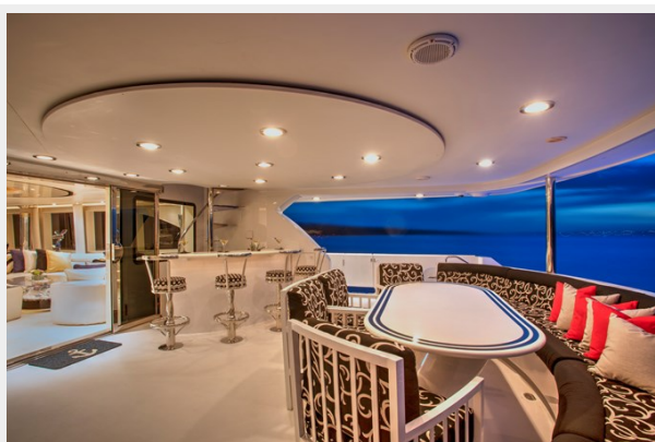
Aft Deck: INVISION 132' 2001/2019 TRIDECK WESTSHIP