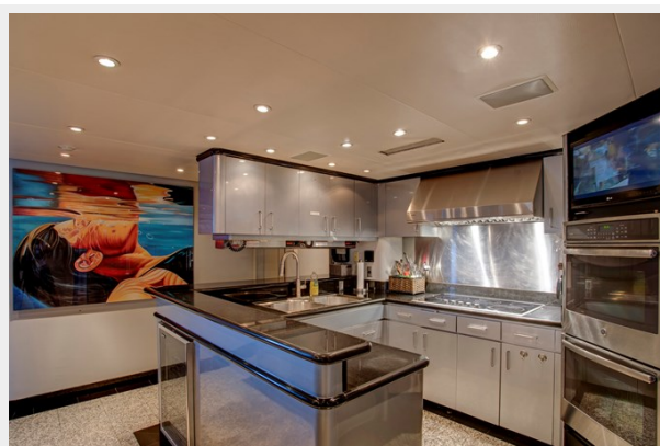
Galley: INVISION 132' 2001/2019 TRIDECK WESTSHIP