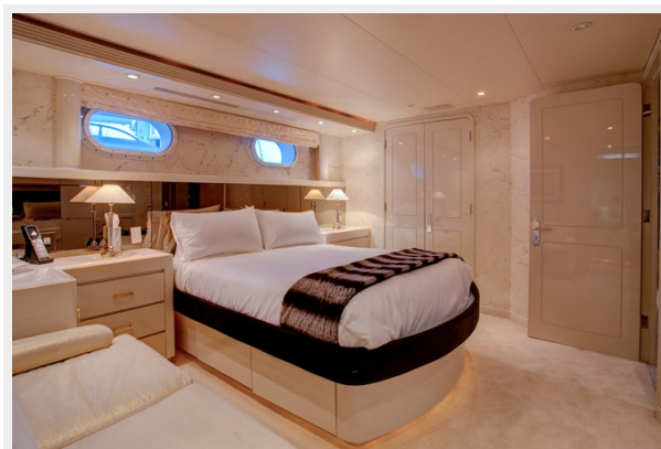
Guest Stateroom 2: INVISION 132' 2001/2019 TRIDECK WESTSHIP