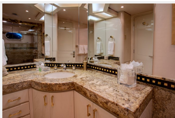
VIP Bath: INVISION 132' 2001/2019 TRIDECK WESTSHIP