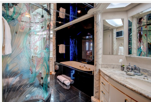
Master Bath: INVISION 132' 2001/2019 TRIDECK WESTSHIP