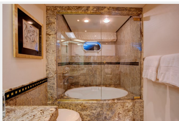
Guest Bath: INVISION 132' 2001/2019 TRIDECK WESTSHIP