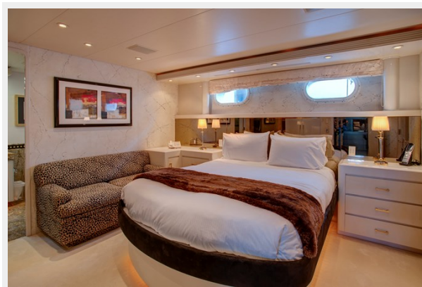
VIP Stateroom: INVISION 132' 2001/2019 TRIDECK WESTSHIP