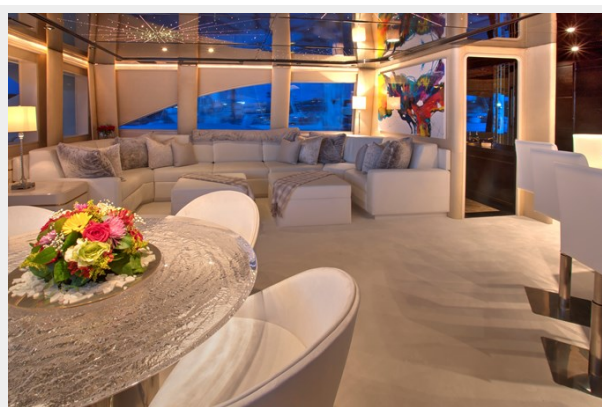
Skylounge: INVISION 132' 2001/2019 TRIDECK WESTSHIP