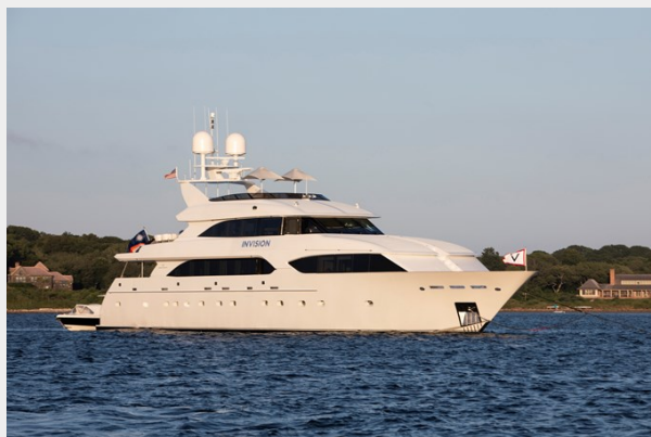
INVISION 132' 2001/2019 TRIDECK WESTSHIP