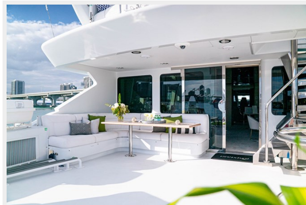
Bridge Deck Aft: INVISION 132' 2001/2019 TRIDECK WESTSHIP