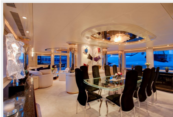
Main Salon Formal Dining: INVISION 132' 2001/2019 TRIDECK WESTSHIP