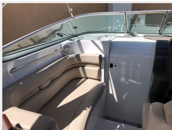
7 - 2013 Rinker 260 EC