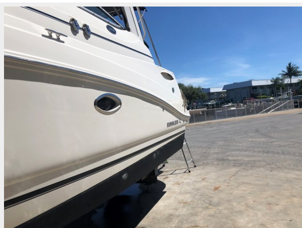
3 - 2013 Rinker 260 EC