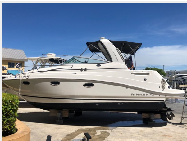
1 - 2013 Rinker 260 EC