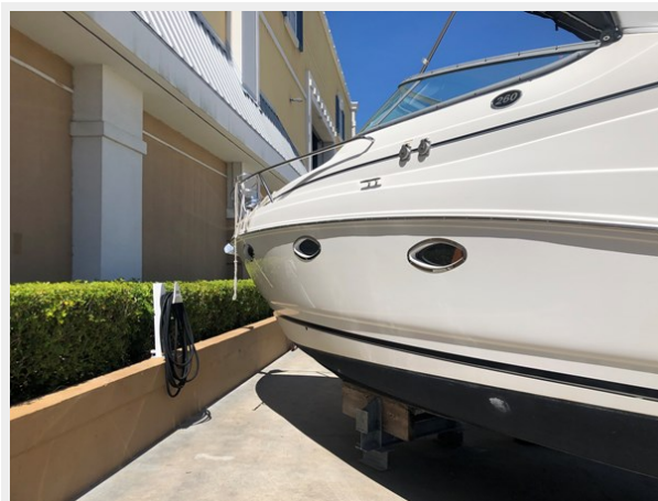
2 - 2013 Rinker 260 EC