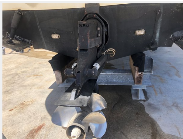
5 - 2013 Rinker 260 EC