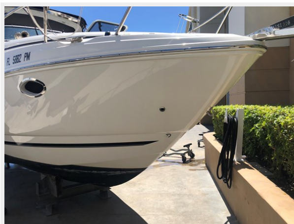
4 - 2013 Rinker 260 EC