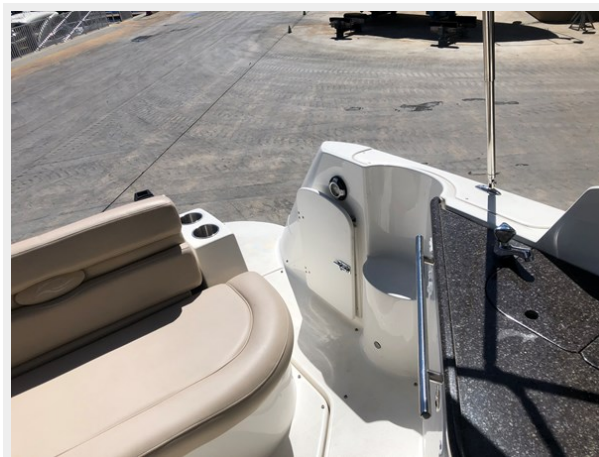
8 - 2013 Rinker 260 EC