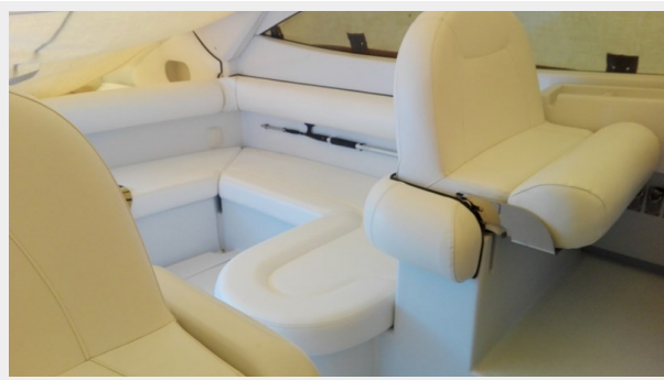
WhatsApp Image 2020-03-07 at 09.42.40