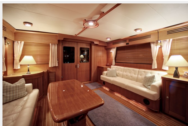
Salon Port Side Aft