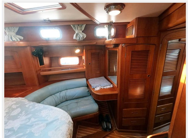
Owners Cabin Port