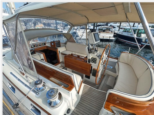
Cockpit Side View