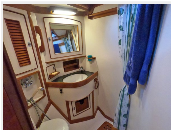
Port Guest Head