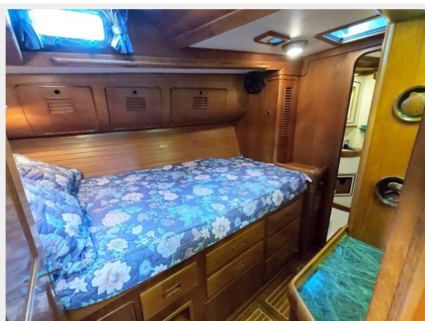
Port Guest Cabin