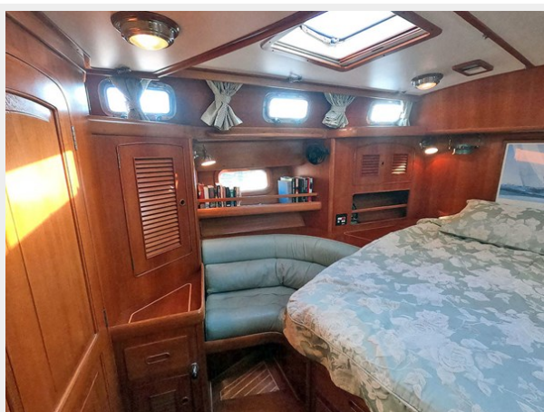
Owners Cabin Starboard