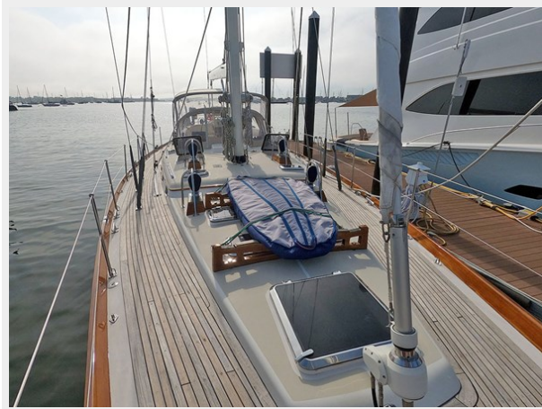
Looking Aft from Bow