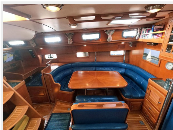
Main Salon, Port