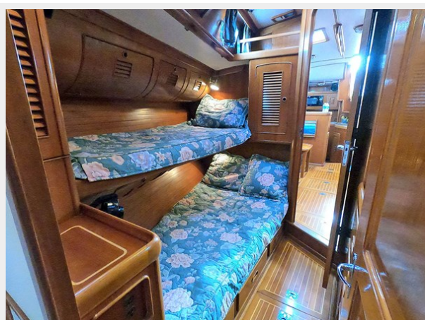
Starboard Guest Cabin