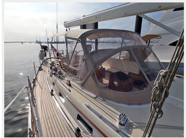
Looking Aft from Mast