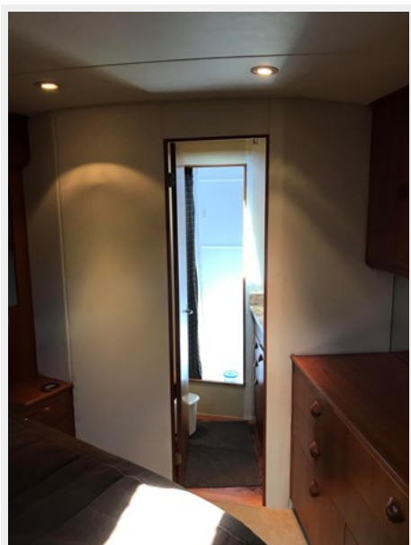
Master Stateroom Head