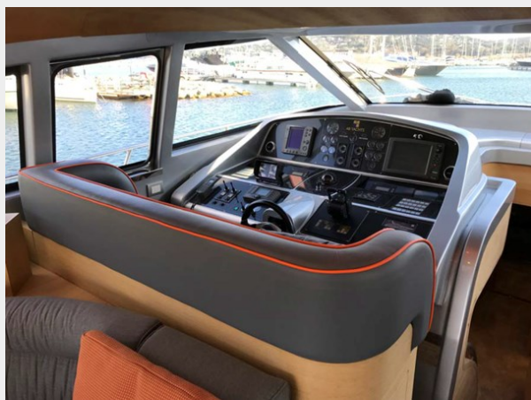
Capture d'écran 2019-02-11 à 10.05.11