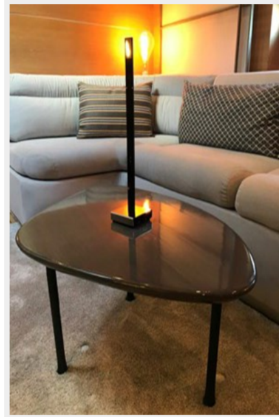
Скриншот 2019-02-11 в 10:05:44