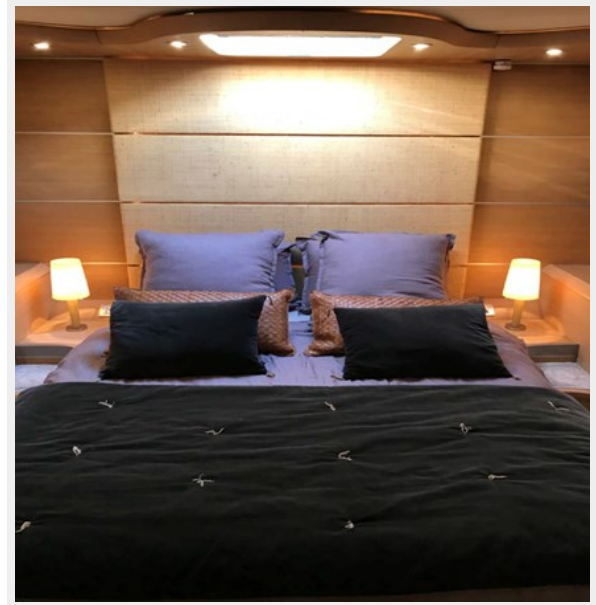
Скриншот экрана 2019-02-11 в 10.06.16