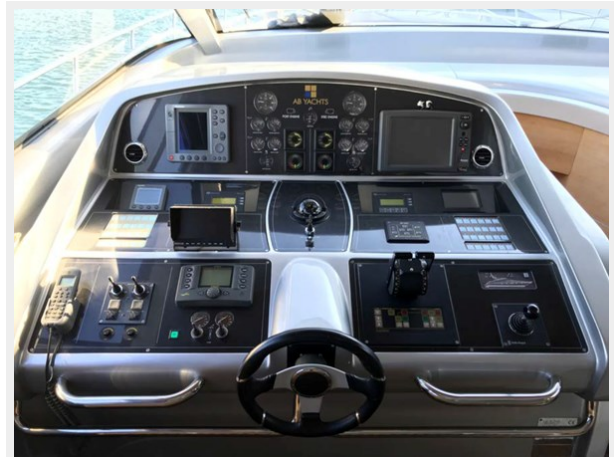
Capture d'écran 2019-02-11 à 10.05.02