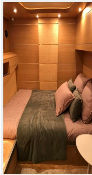
Capture d'écran 2019-02-11 à 10.06.57