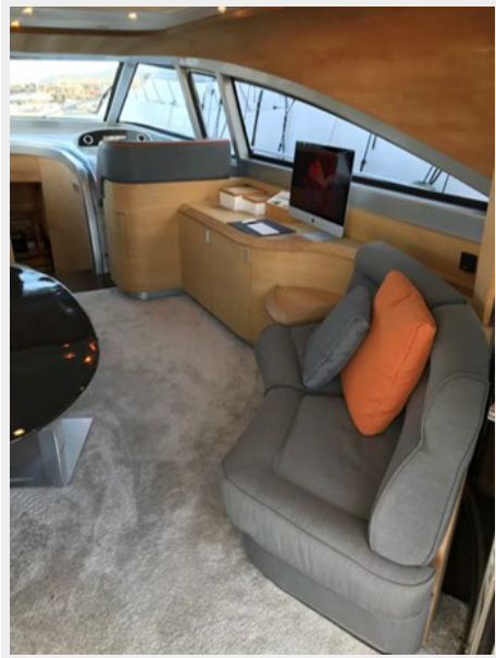
Capture d'écran 2019-02-11 à 10.04.54