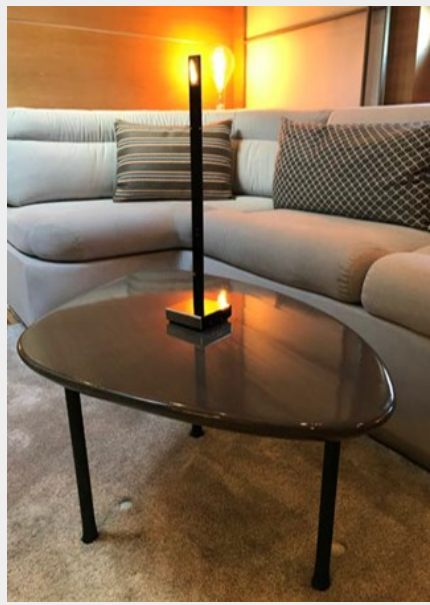
Скриншот экрана 2019-02-11 в 10.06.05