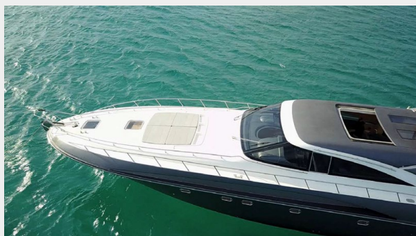
Capture d'écran 2019-02-11 à 10.04.04