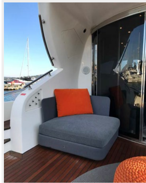
Capture d'écran 2019-02-11 à 10.04.39