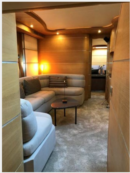
Скриншот 2019-02-11 в 10:05:26