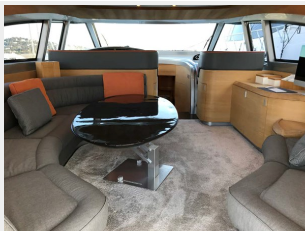
Capture d'écran 2019-02-11 à 10.04.29