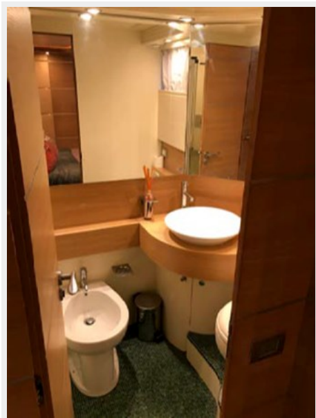
Capture d'écran 2019-02-11 à 10.07.10