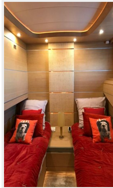
Capture d'écran 2019-02-11 à 10.07.06