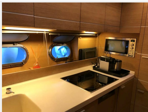
Скриншот 2019-02-11 в 10:05:36