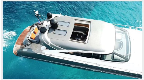
Capture d'écran 2019-02-11 à 10.03.55