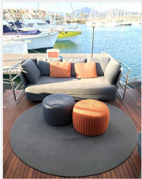
Capture d'écran 2019-02-11 à 10.04.20