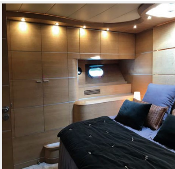
Скриншот экрана 2019-02-11 в 10.06.25