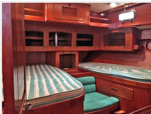
Owner's Cabin, Looking Aft