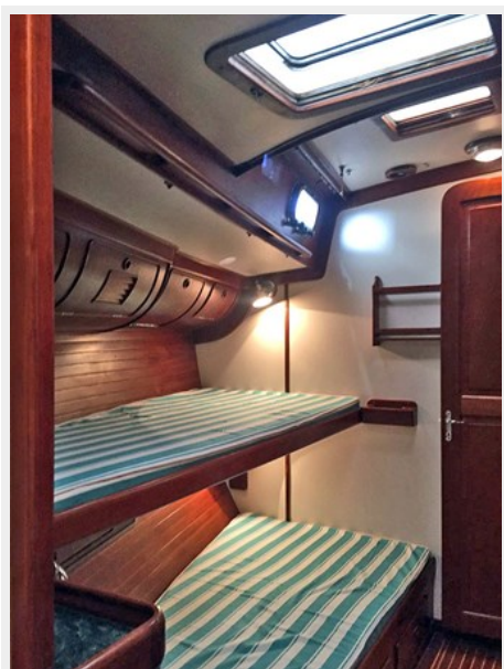
Stbd. Guest Cabin