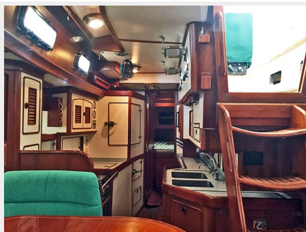
Salon Aft to Galley