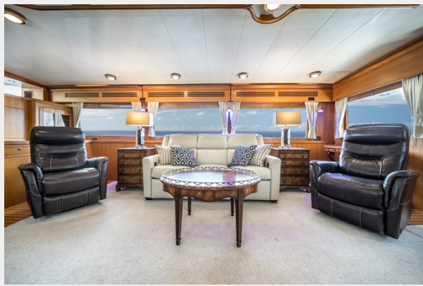
Salon facing Starboard