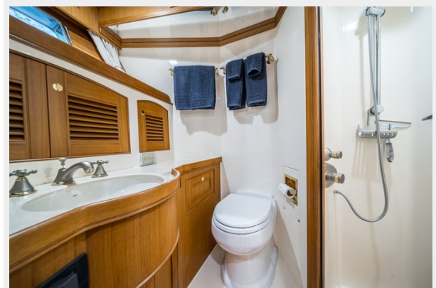
Portside Guest Head