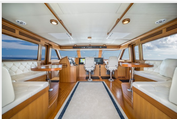
Commandbridge facing Forward