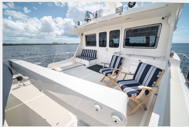
Upper Aft Deck facing Portside