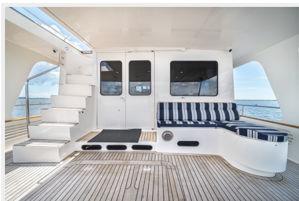
Aft Deck facing Forward