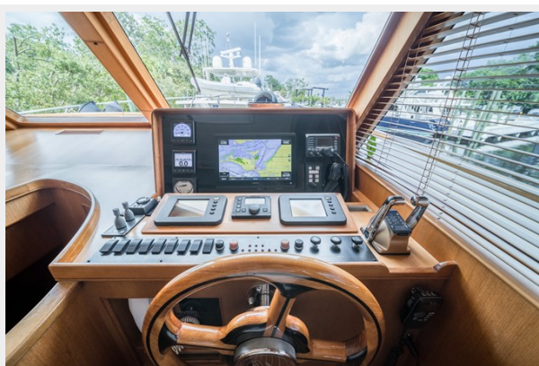
Mini Helm Station