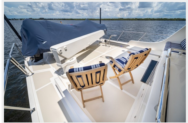
Upper Aft Deck