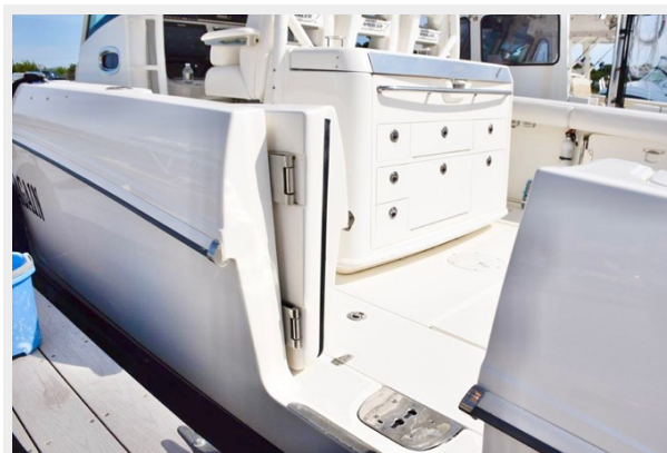
Dive door - boarding gate