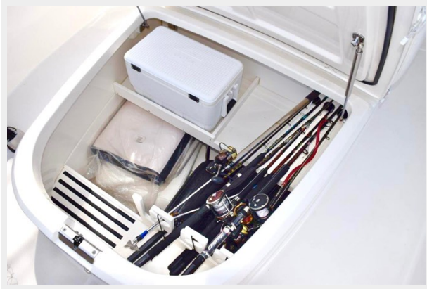
Storage under forward lounge