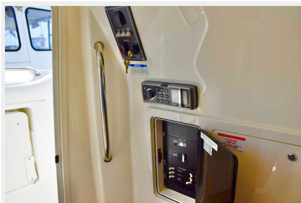
Electrical panel (110v AC)