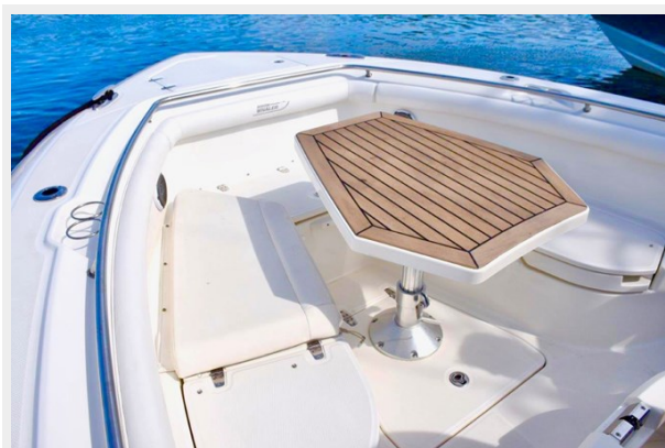
Forward seating with table raised