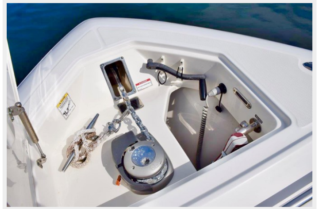
Windlass and anchor chute