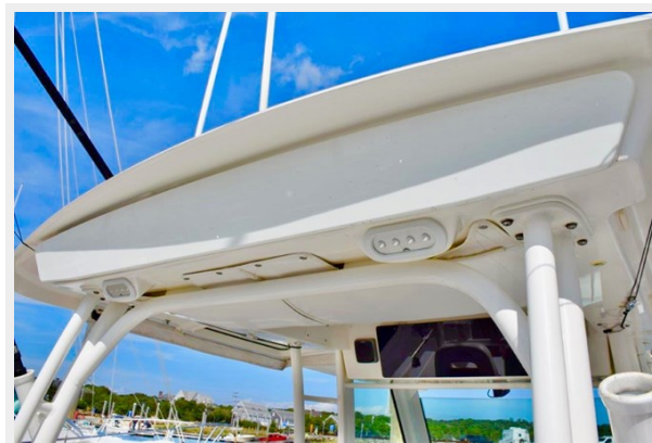
Electric retractable sunshade