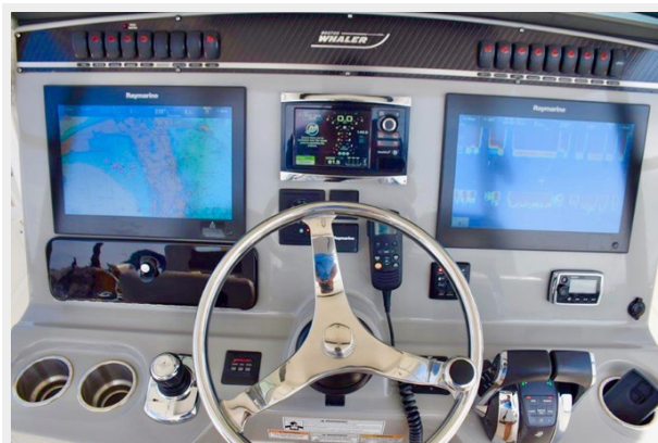
Electronics and Controls