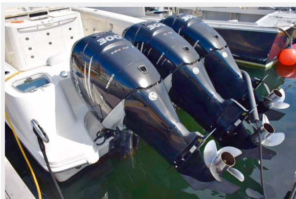
Triple 300hp Verados