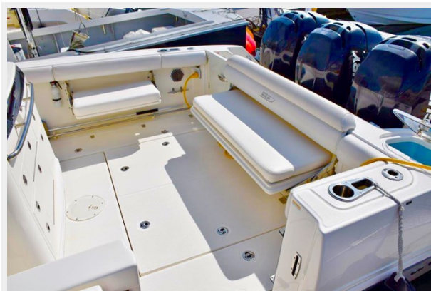
Cockpit fold down seating