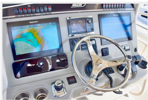
Raymarine Hybrid multifunction screens