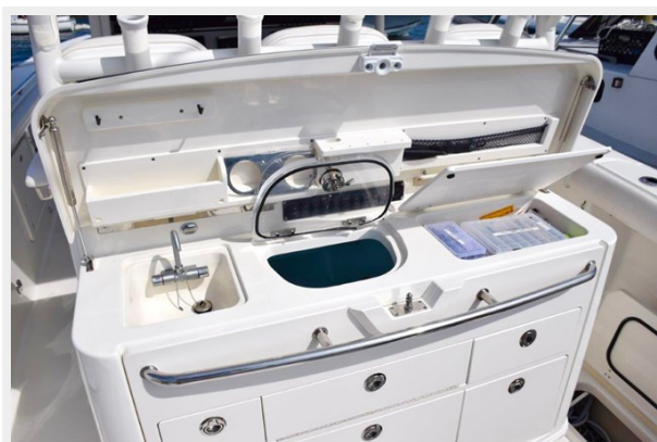
Rigging station and Livewell