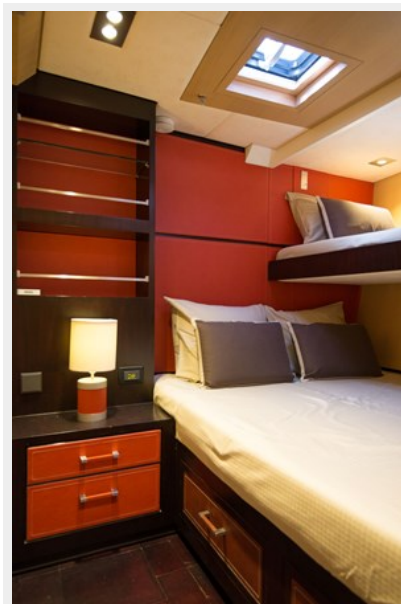
Prt guest (3)