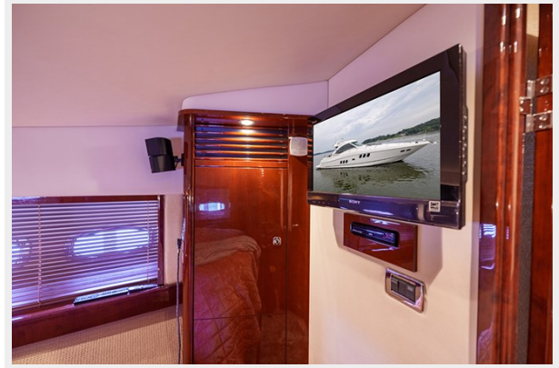
Entertainment center in the VIP stateroom