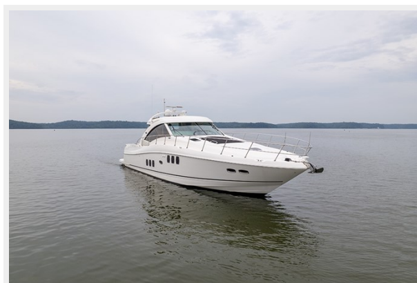
Stbd bow profile