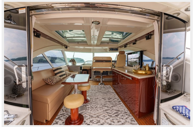
Entry to the upper salon