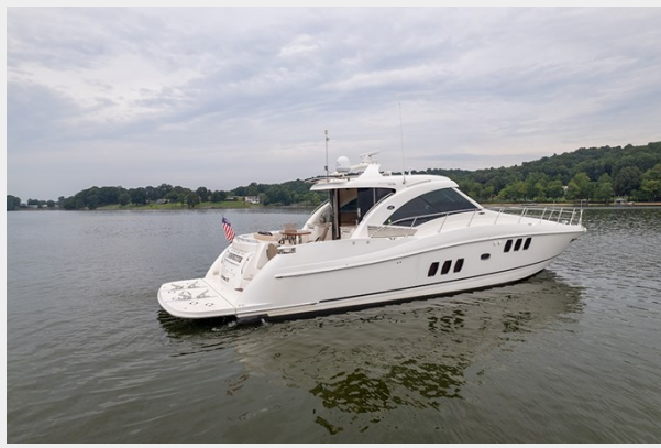
Stbd quarter profile