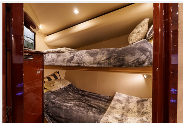
Guest/Bunk stateroom view 2