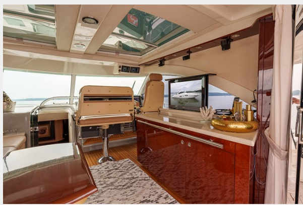
Stbd upper salon