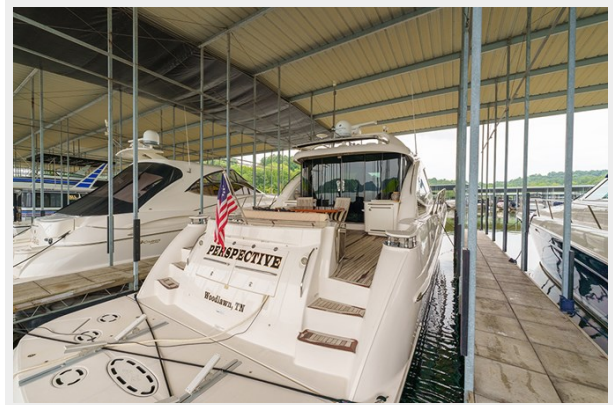
Stern profile 2 (in slip)