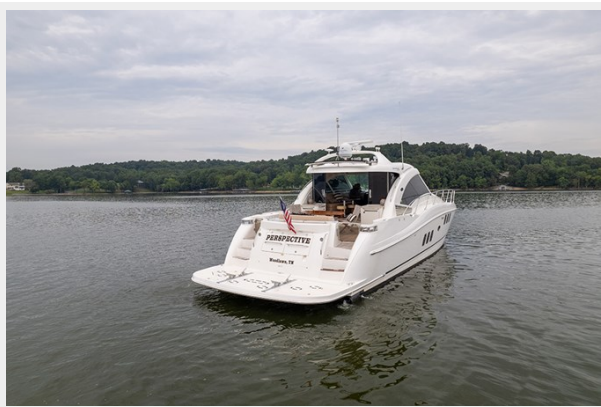
Stbd quarter profile 2