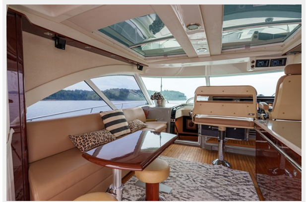
Port upper salon