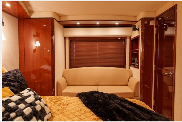
Sofa in the master stateroom