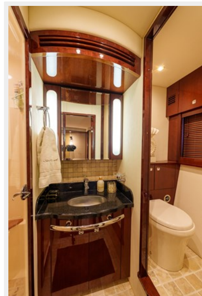
Master head with vanity