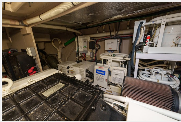
Engine room view 2