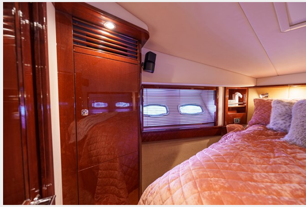
VIP stateroom view 2