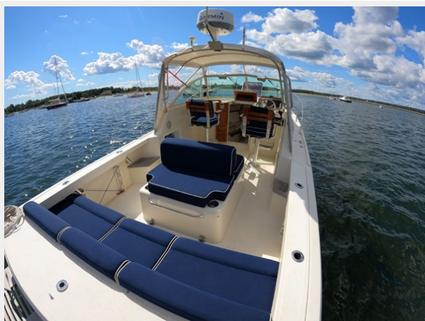
Stern Seat Looking Forward