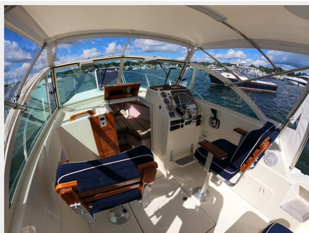
Helm and Companionway Looking Forward