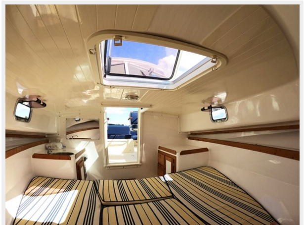
Cabin Looking Aft w/ Filler