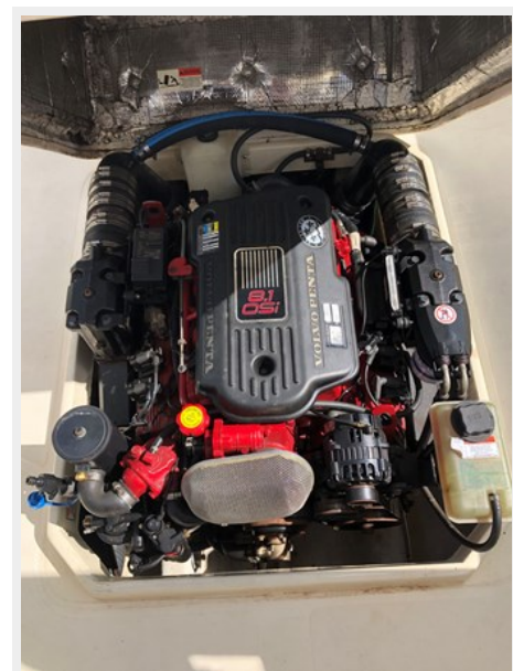
Big Block Engine