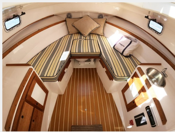
Cabin Looking fwd with Filler