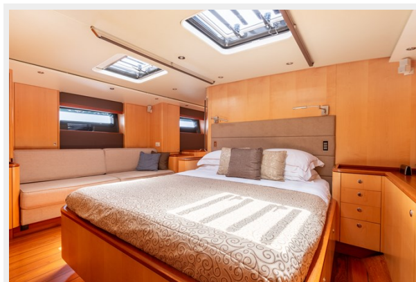
ivanka-Master Cabin 1