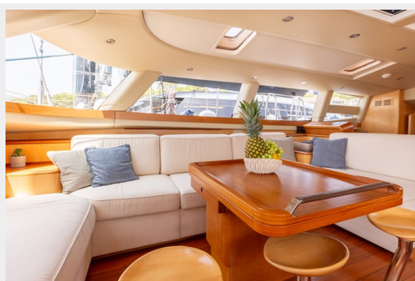
ivanka-Main Saloon 3