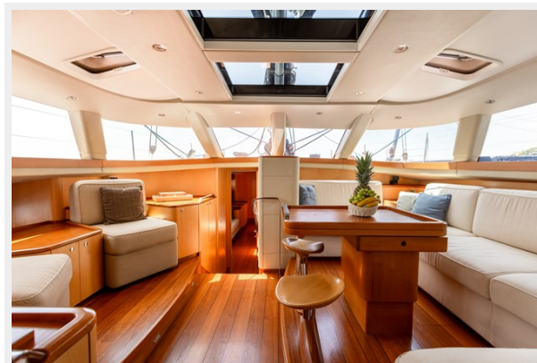
ivanka-Main Saloon 2