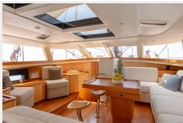
ivanka-Main Saloon 1