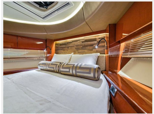
Bow VIP Stateroom 2