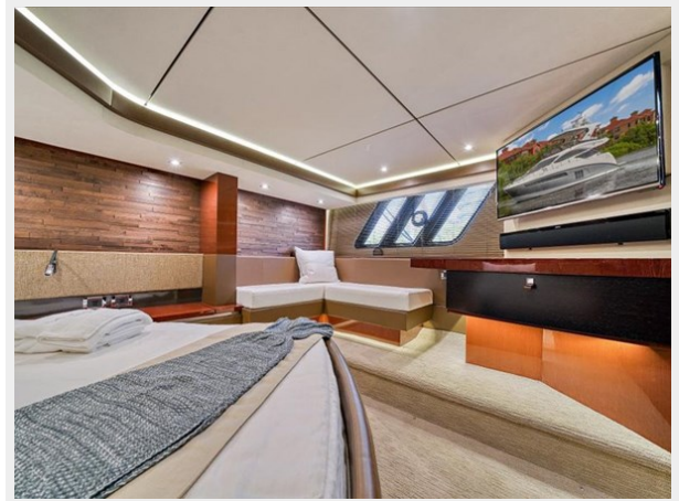
Master Stateroom 3