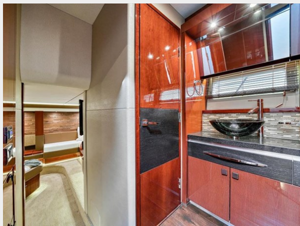
Master Head 1