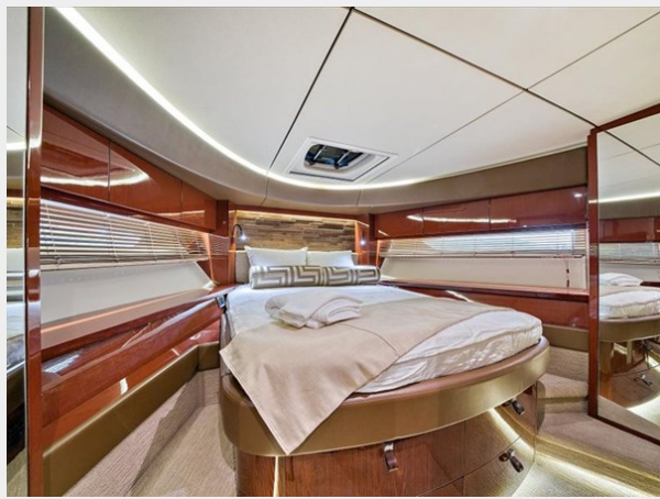
Bow VIP Stateroom 1