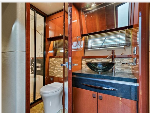
Master Head 3