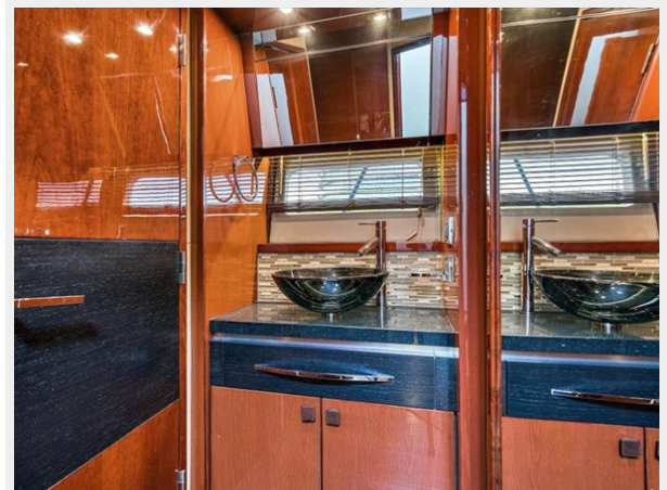
Master Head 2