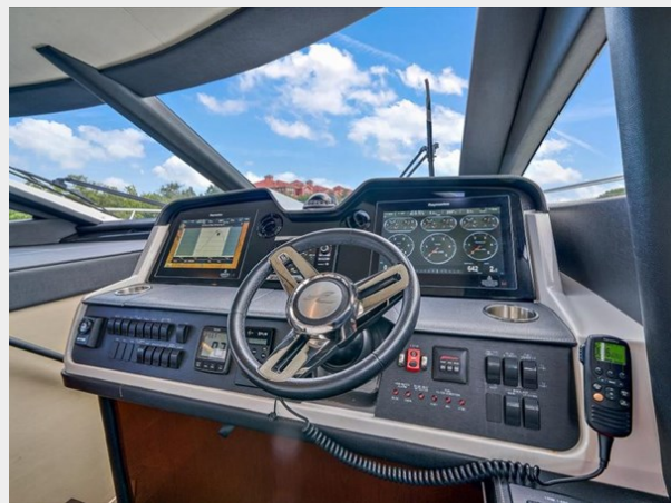
Lower Helm 2