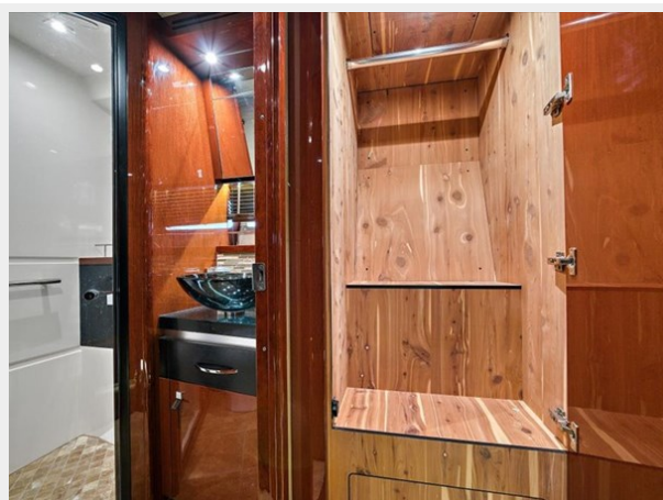
Bow/ STB Strm/ Day Head 2