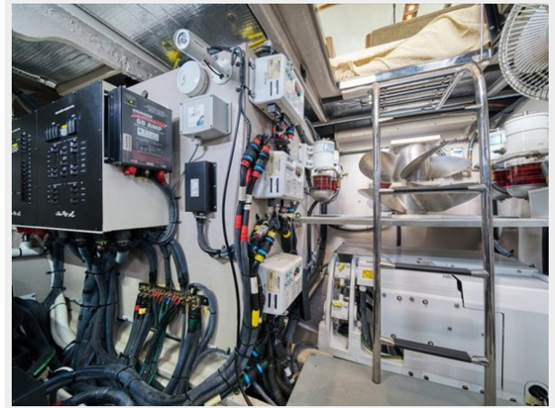
Engine Room 2