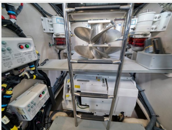
SeaKeeper 16 Gyro and Spare Props