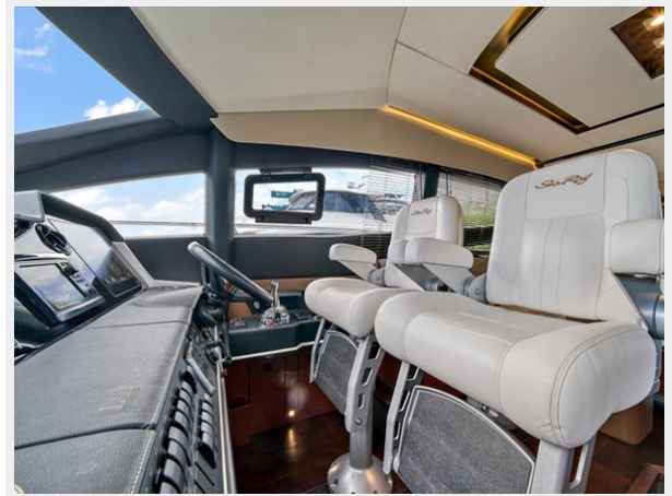
Lower Helm 1