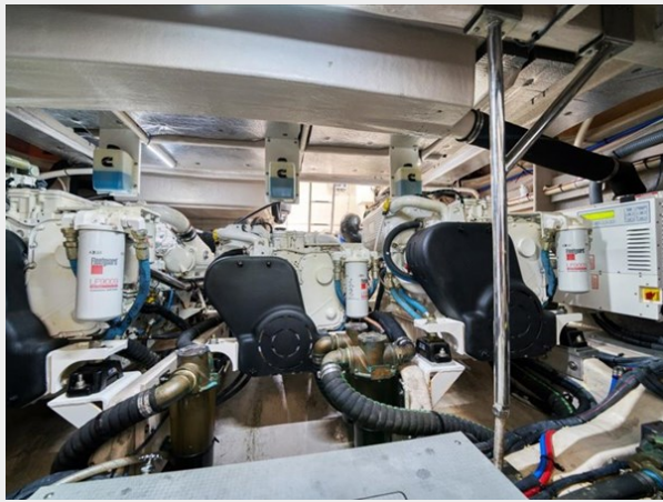
Engine Room 1