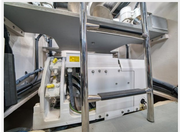
Engine Room 4