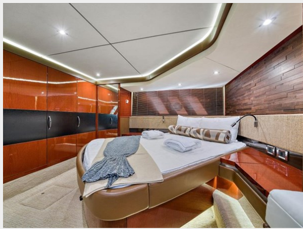
Master Stateroom 2