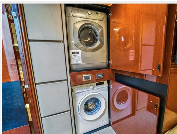
Washer Dryer/ STB Stateroom