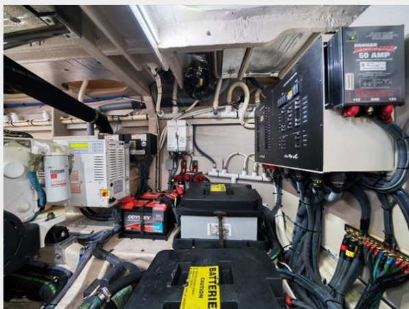
Engine Room 3