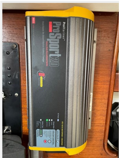
31 Nav Desk