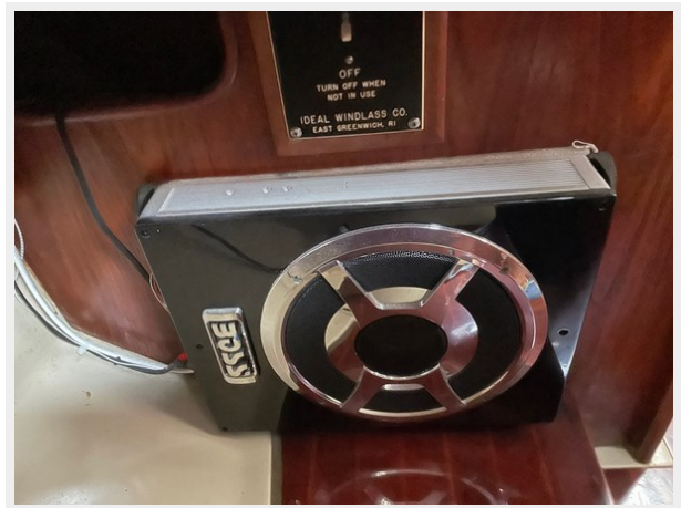
32 Nav Desk