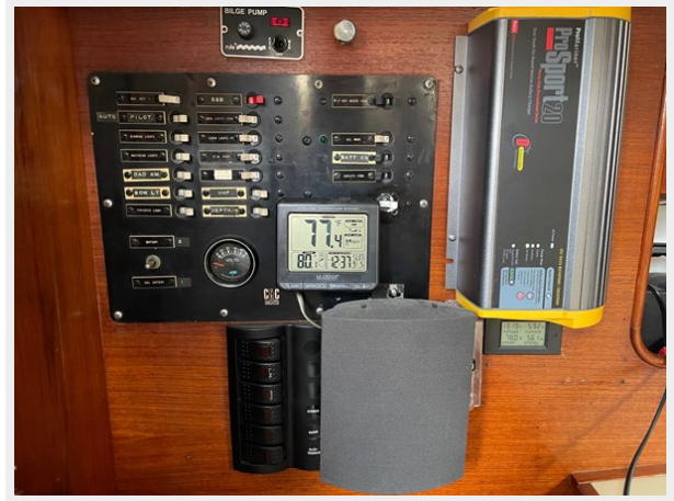
30 Nav Desk