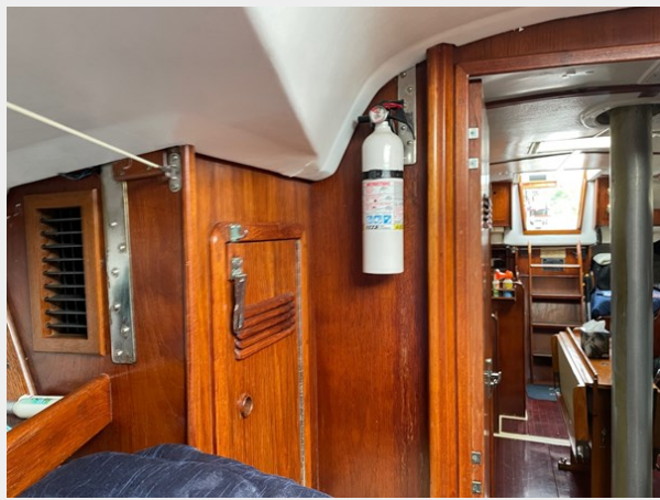
45 V Berth Aft