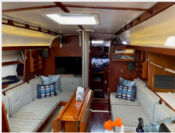
57 Salon Lights