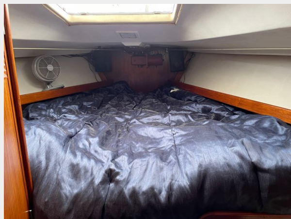
43 V Berth