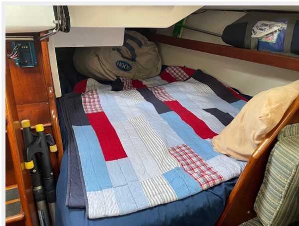
26 Quarter Berth