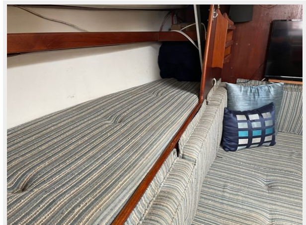
38 Pilot Berth