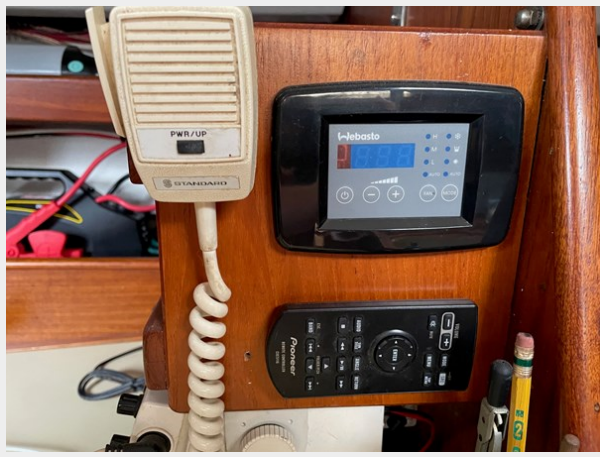
29 Nav Desk