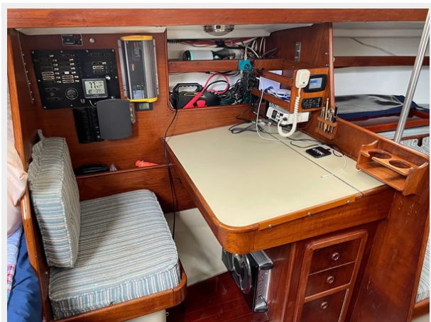
27 Nav Desk