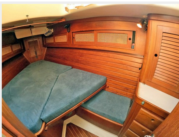
Fwd. Berth with Filler