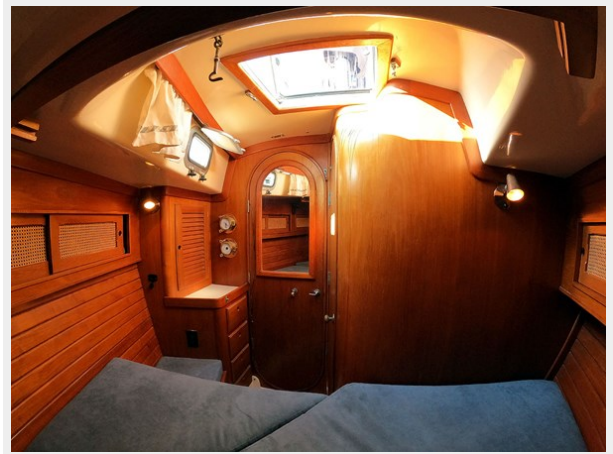
Fwd. Cabin, Overhead