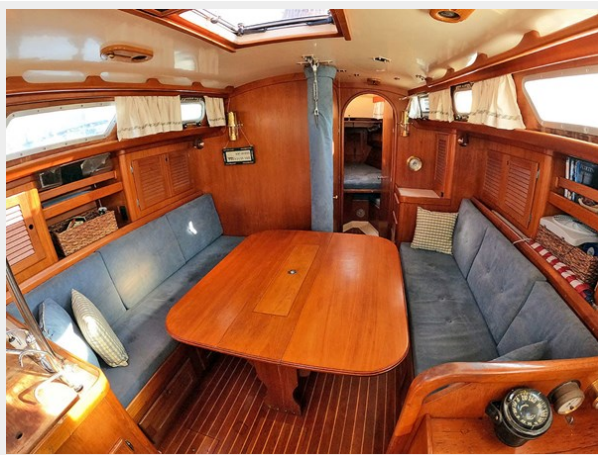
Drop-leaf Table, Extended