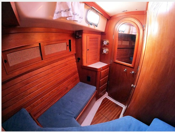
Fwd. Cabin Settee