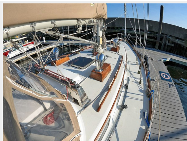
Deck, Looking Fwd.