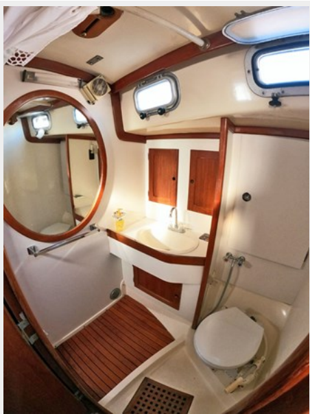
Head and Shower, Looking Aft