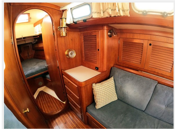
Salon Hanging Locker and Drawers