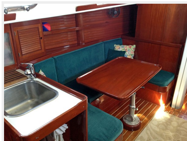
Salon to Port