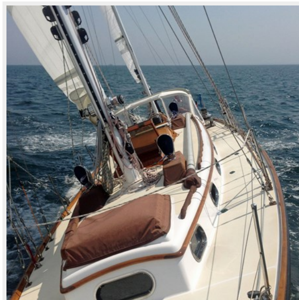
Sailing, Looking Aft