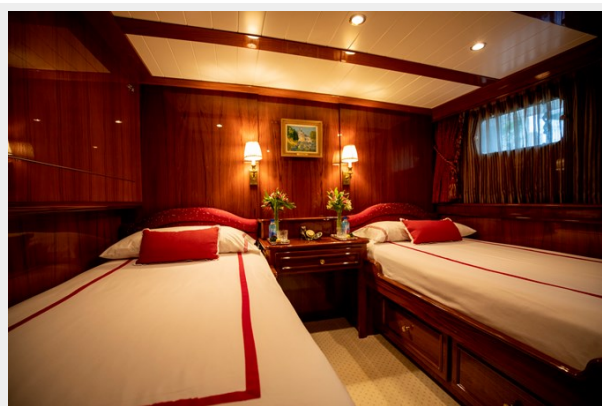
Port guest cabin