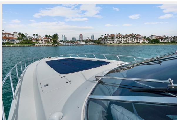
Bow Side View