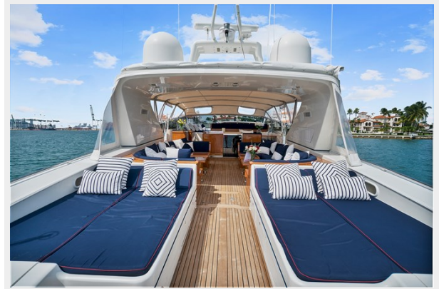
Aft Sun Deck