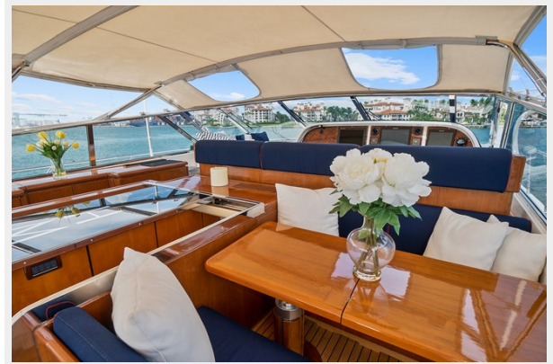
Additional Dinning Table