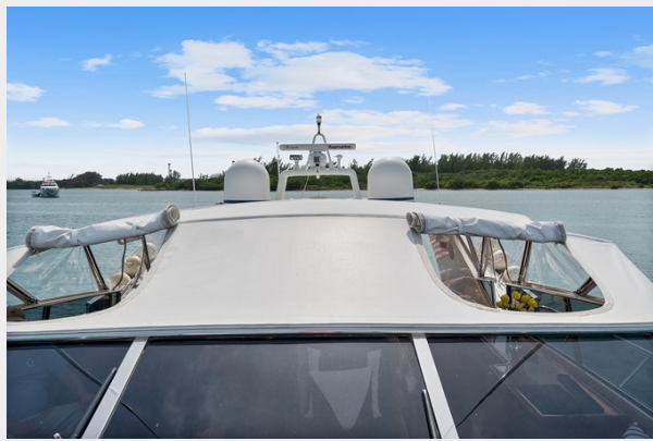
Bridge Roof Vent