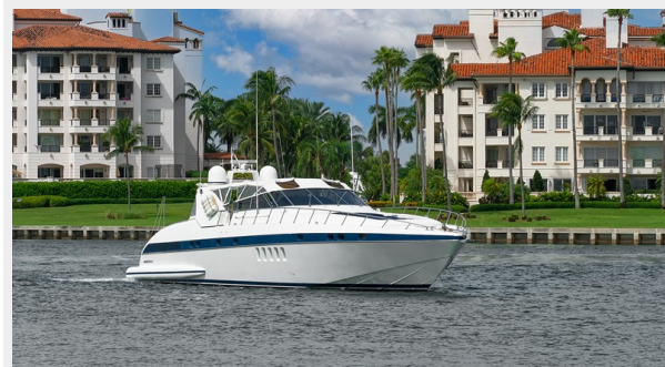
Exterior Port side