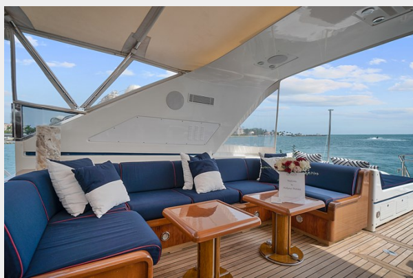
Open Dining Area Starboard