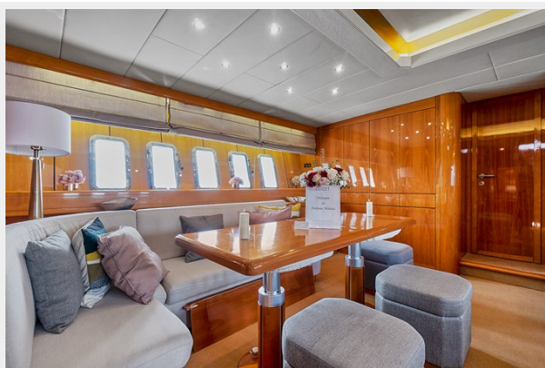
Saloon Dinning Table