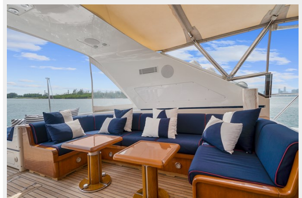
Open Dining Area Port Side