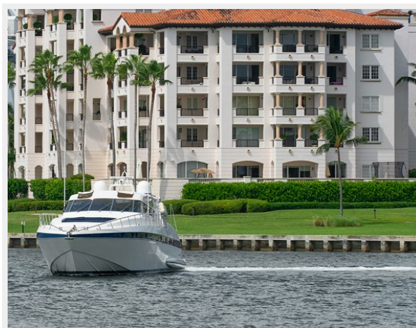
Exterior Port side