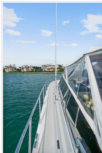
Port Side Walkway