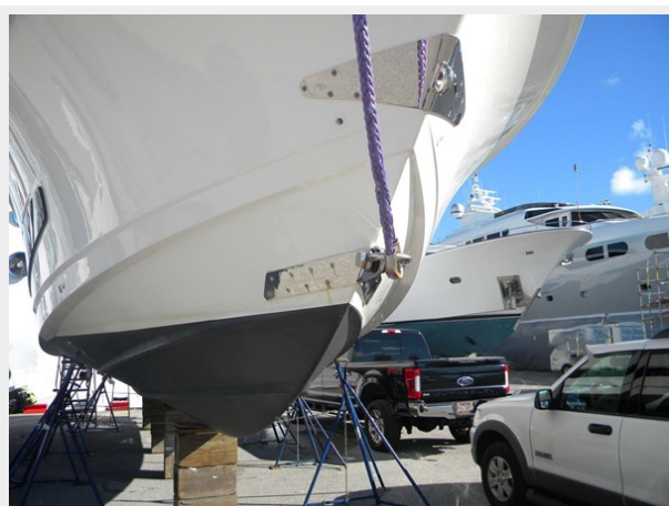
Bow Trailer Eye Lower Tow Eye Strap Upper