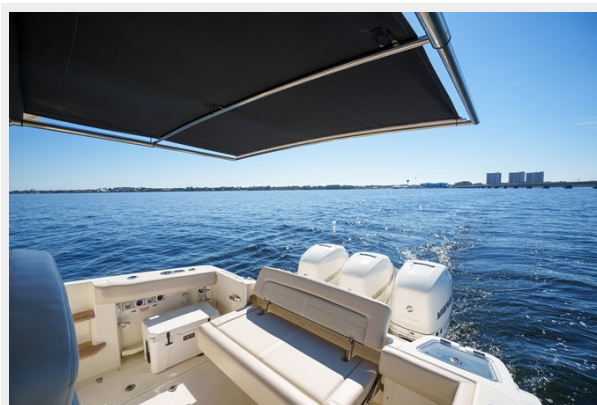
Aft cockpit with electric retractable sunshade