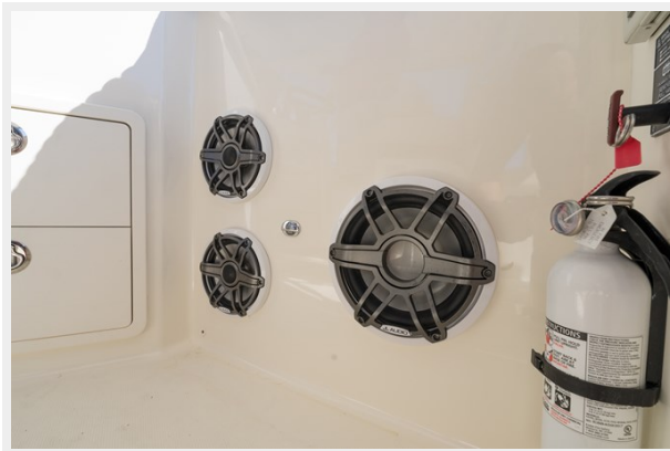
JL Audio speakers at the stbd helm deck counter