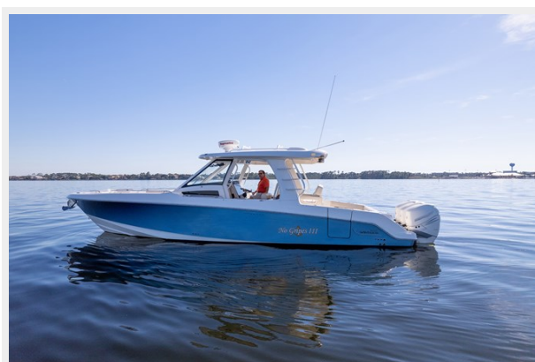
Port profile 2