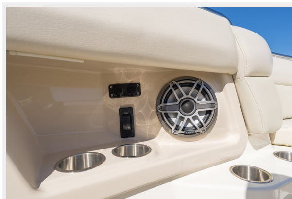
Speaker and cup holders in the bow area