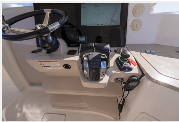
Mercury throttle control and joystick control with Skyhook