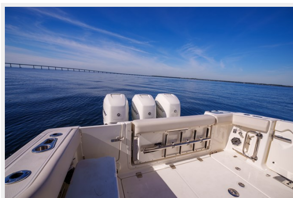
Aft cockpit view 2