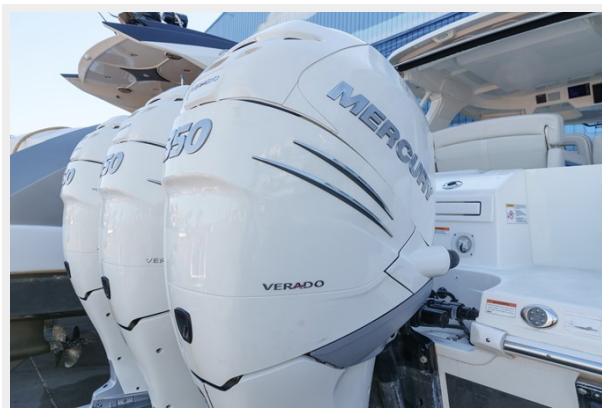
Triple engines view from stbd