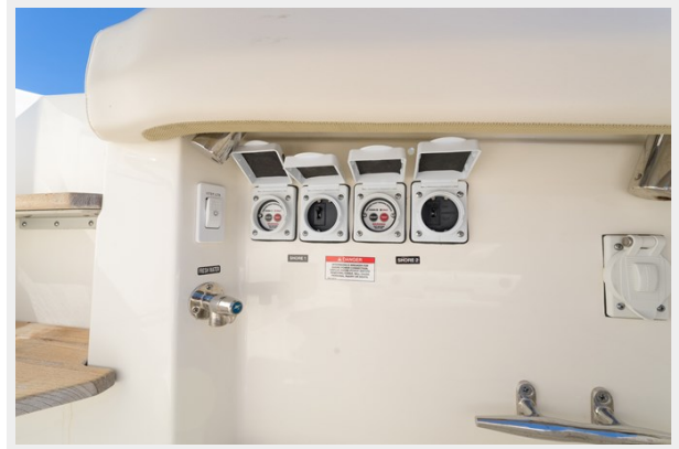
Ground fault sensing modules and Marinco switches