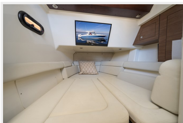
Opposing seating converted to a berth