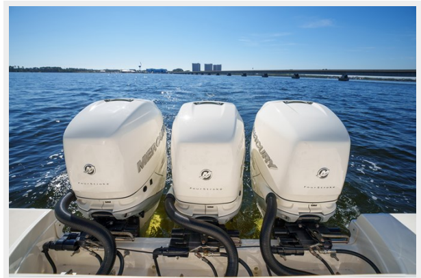
Triple engines view 2