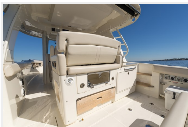
Cockpit/Helm deck second row reversible seat