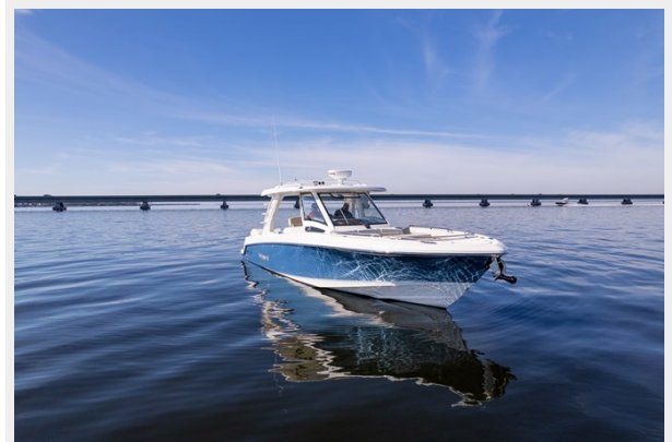
Stbd bow profile