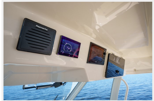
Additional electronics at the helm