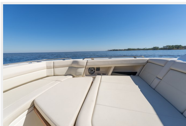
Bow seating with filler