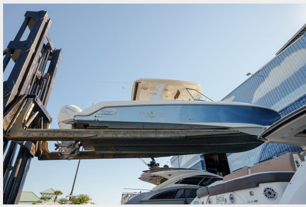
Stbd profile (on lift)