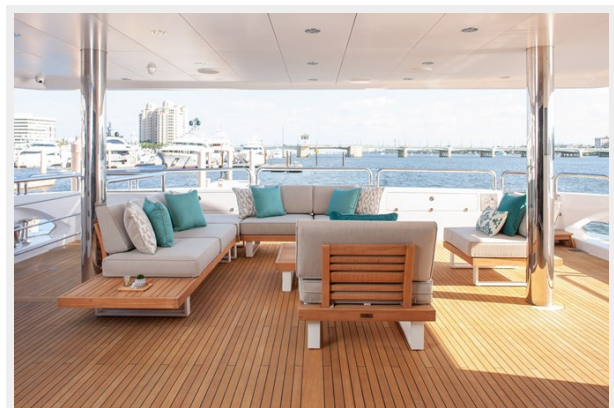
Q Sunseeker 155 Yacht Main Deck