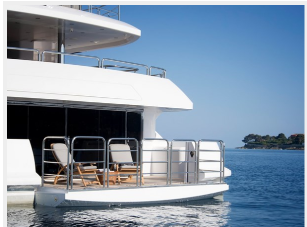
Q Sunseeker 155 Yacht Beach Club