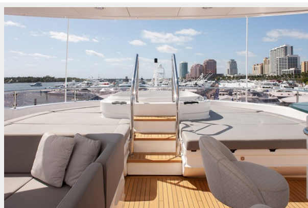
Q Sunseeker 155 Yacht Sky Deck