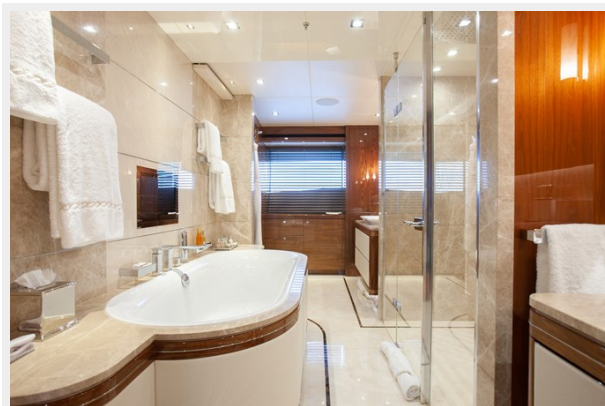
Q Sunseeker 155 Yacht Master Suite