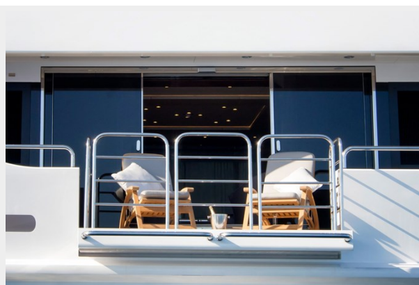
Q Sunseeker 155 Yacht Sky-Lounge Balcony