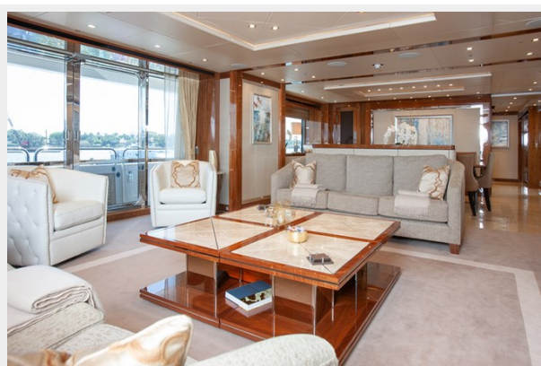
Q Sunseeker 155 Yacht Main SaloonArea