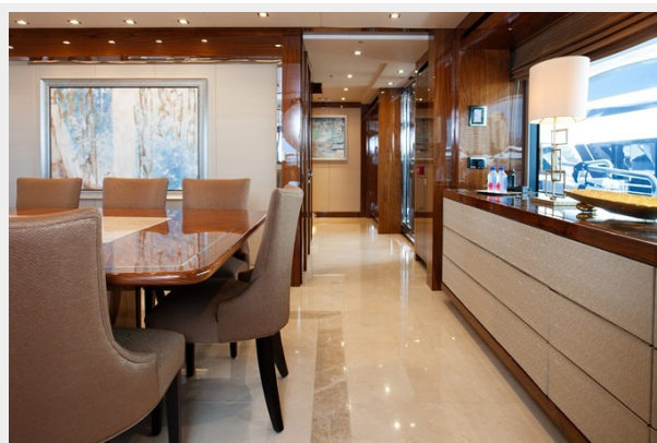
Q Sunseeker 155 Yacht Dining Area