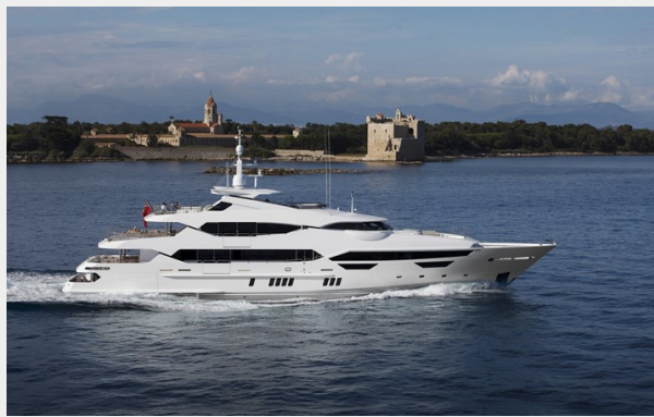
Q Sunseeker 155 Yacht Running