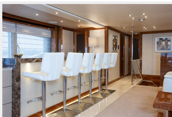
Q Sunseeker 155 Yacht Sky Lounge