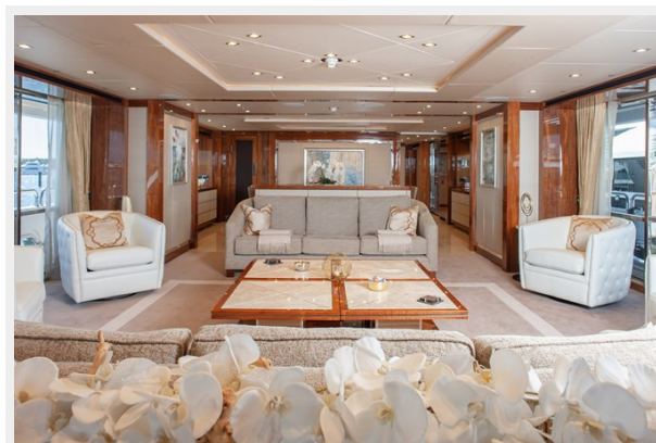
Q Sunseeker 155 Yacht Main Saloon