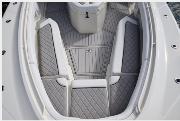
Forward Aqua Deck