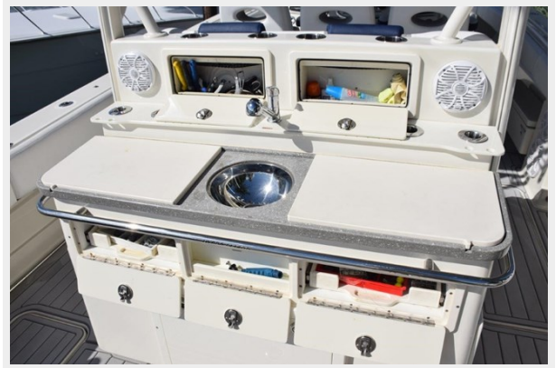
Rigging station cabinets open