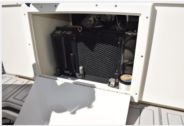
New cockpit Air Conditioning unit