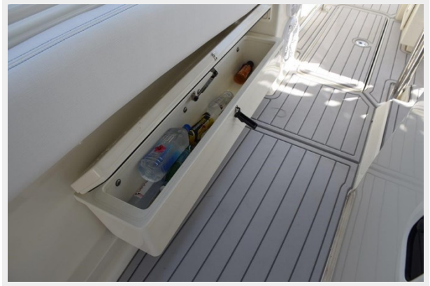
2 Frigid Rigid drink cooler