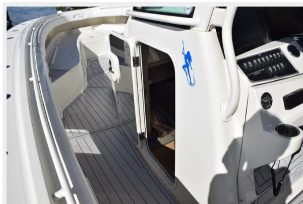
Cabin Entry Door