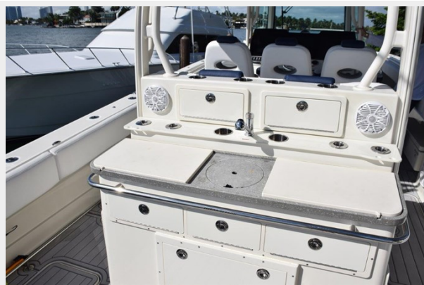
Rigging station-Summer Kitchen