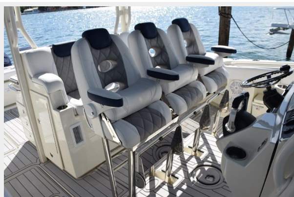
Two Row Seating with air vents