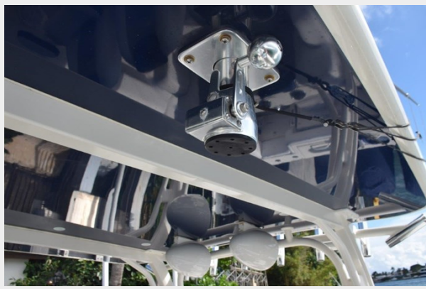
Radial outriggers-carbon poles