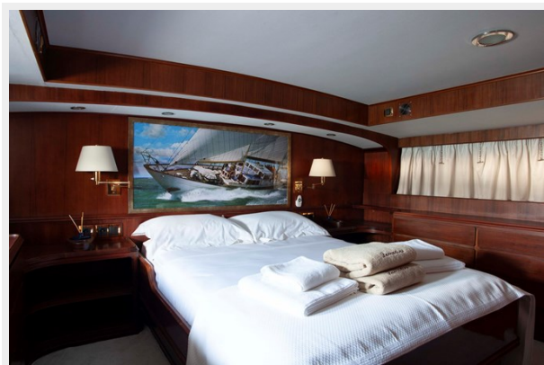
LAMADINE double cabin