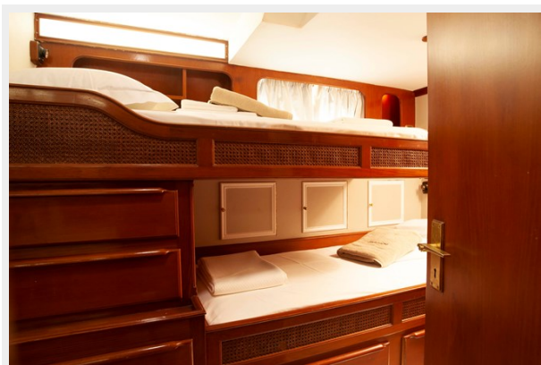
LAMADINE twin room aft