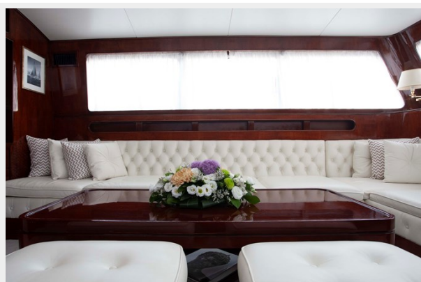
LAMADINE main salon