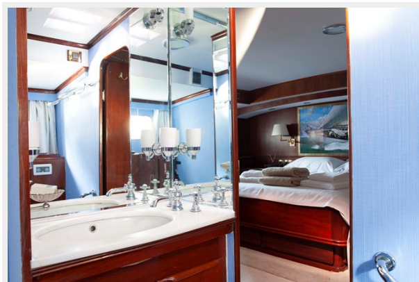
LAMADINE double cabin bathroom