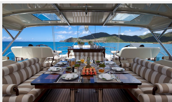
Tiara - Flybridge dining