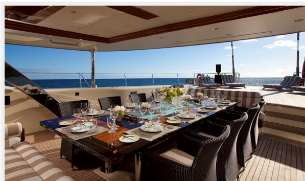
Tiara-4997