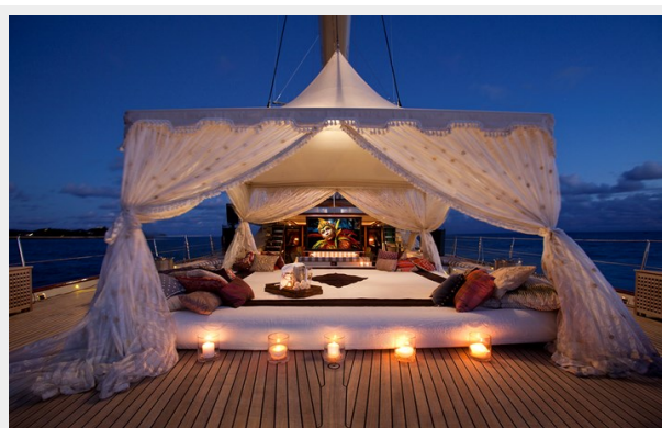
Tiara - Tent Outdoor Cinema