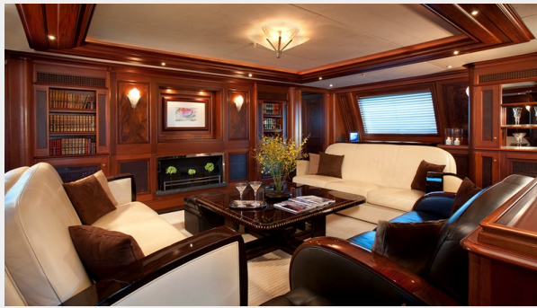
Tiara - Salon