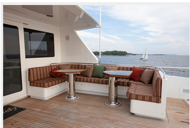
Upper Deck Seating