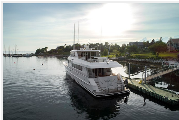
Port Stern Profile