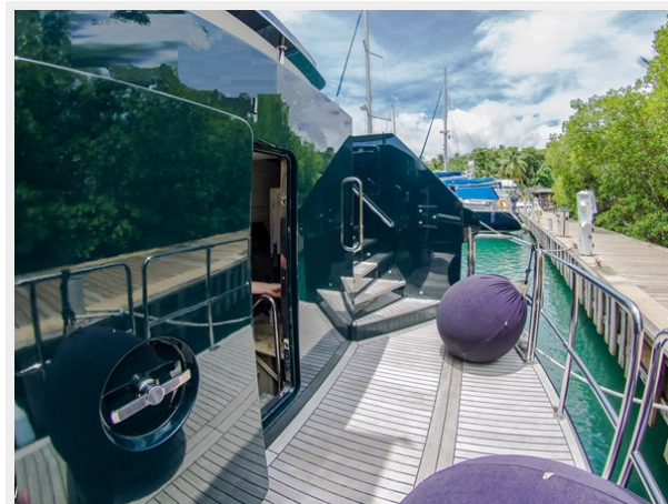
large and friendly outside areas