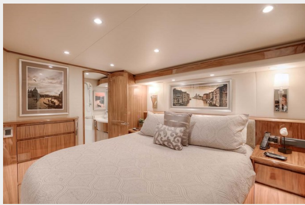
Beautiful Maple Finish Cabinetry