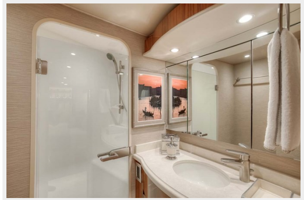
One-Piece Custom Frameless Shower Door