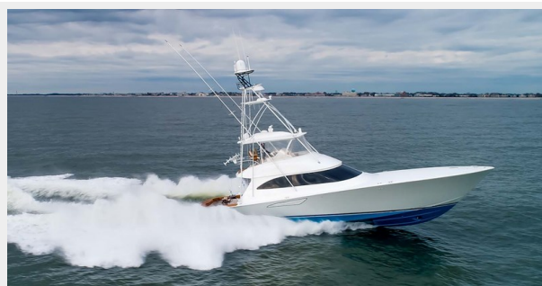
Starboard Running Profile