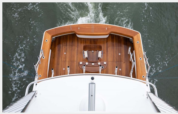
Tower View to the Cockpit