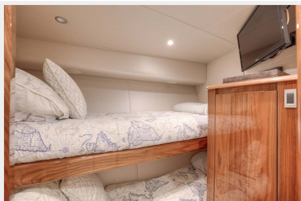
Guest Flat Screen TV