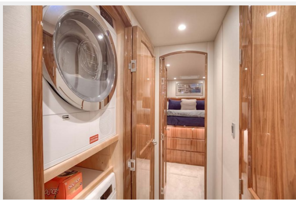
Washer and Dryer and VIP Stateroom