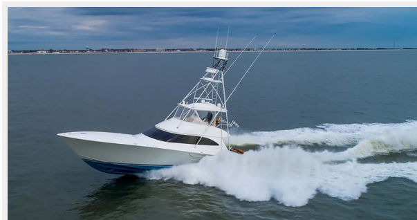
Port Running Profile