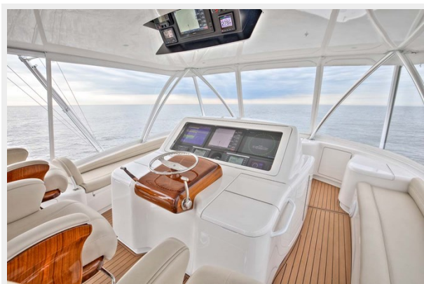
Helm Station with Overhead Electronics