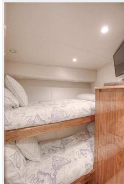
Guest Twin Bunk Berths