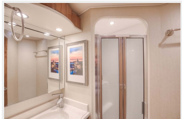
Guest Head and Shower