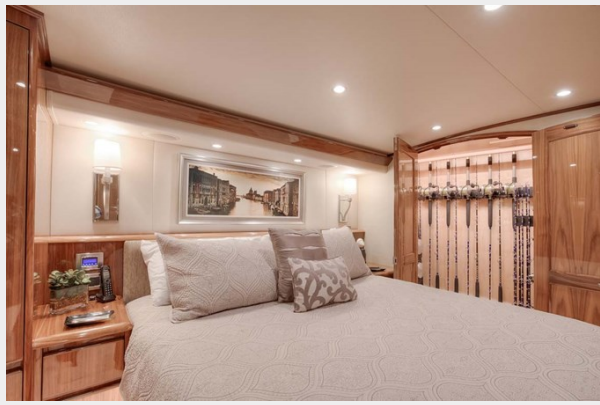
Walkaround Queen Bed with Upholstered Headboard