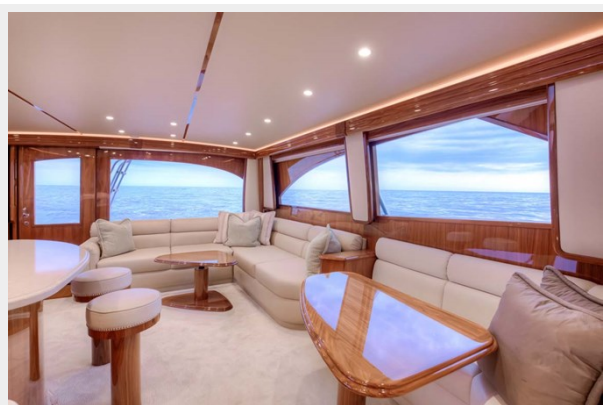
Main Salon to Port