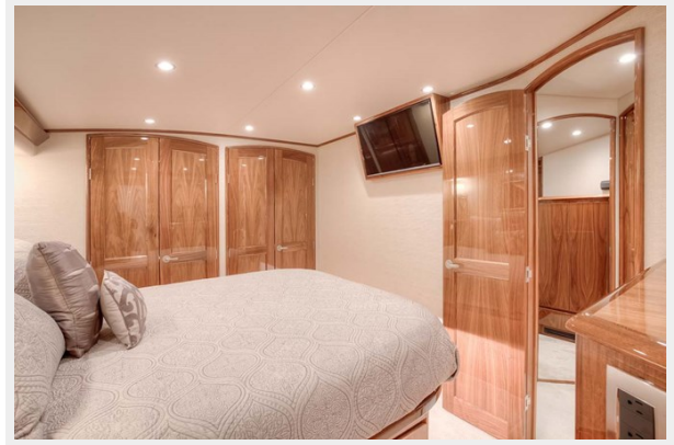
Master Stateroom View to Flat Screen TV