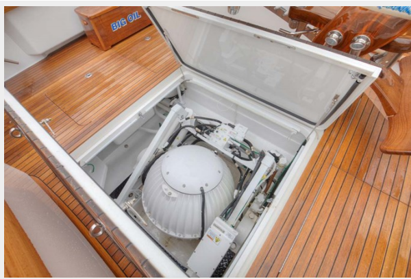
Seakeeper Gyro SK 26