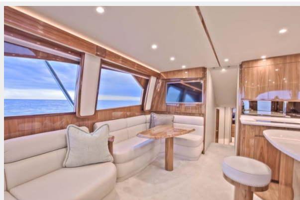
Salon Settee and Dinette