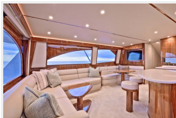
Salon Settee to Port Aft