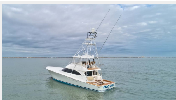
Port Aft Quarter