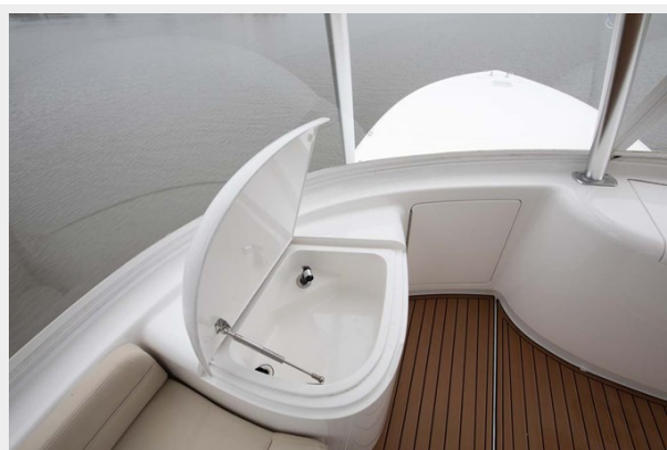
Flybridge Port Forward Wet Bar