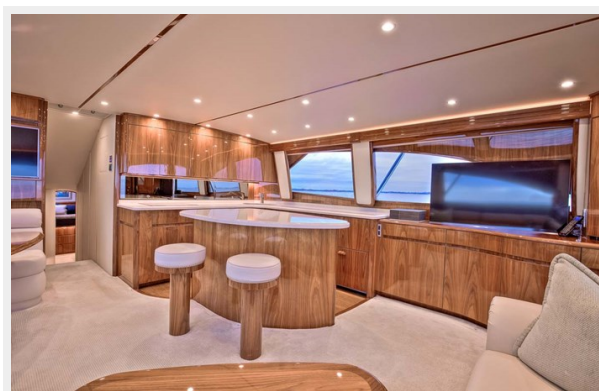
Salon and Flat Screen TV