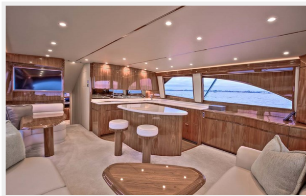
Salon Starboard Side Galley View