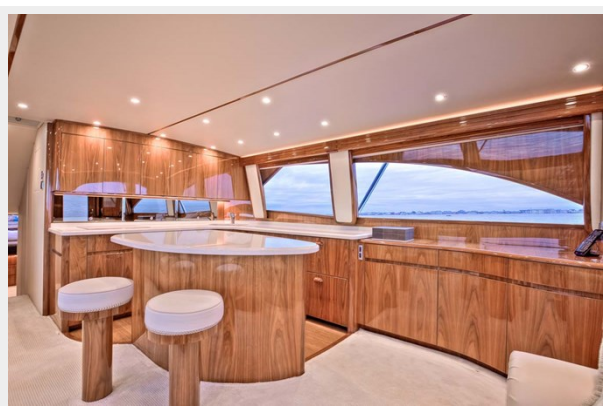
Two Bar Stools and Galley