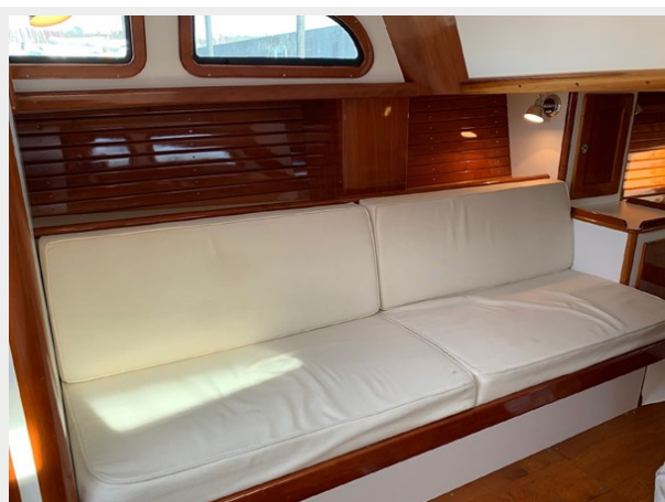
Main Cabin Port