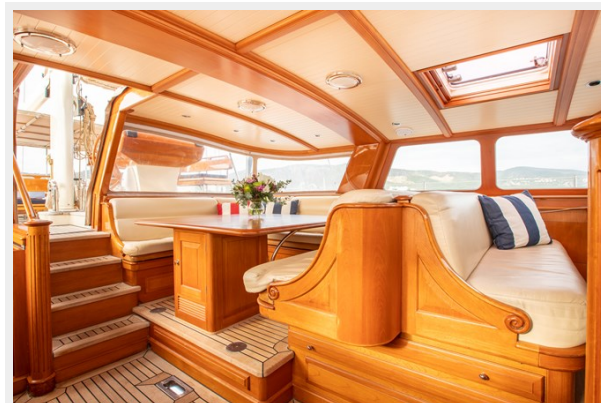
Pilothouse Port Side Aft