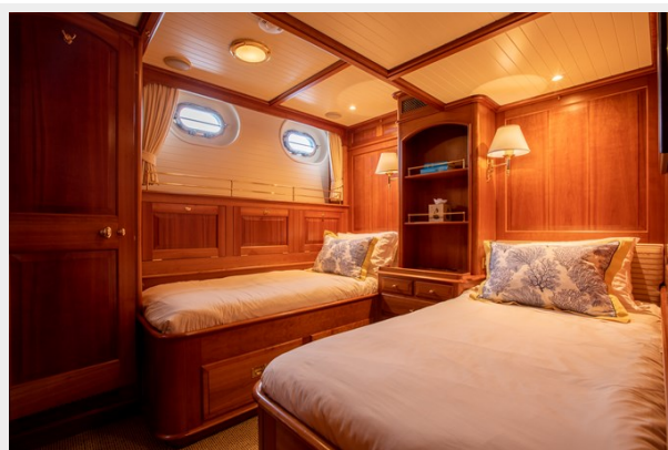
Port Guest Stateroom