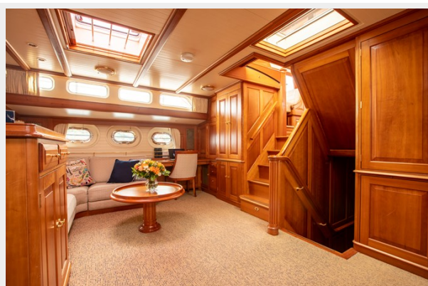
Salon Starboard Aft