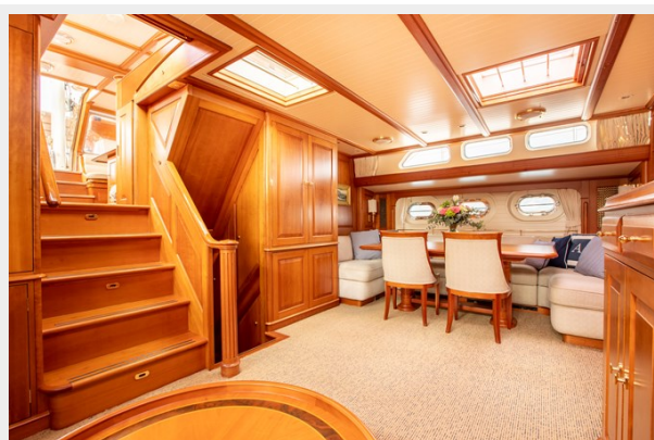
Salon Port Side