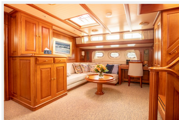
Salon Starboard Forward