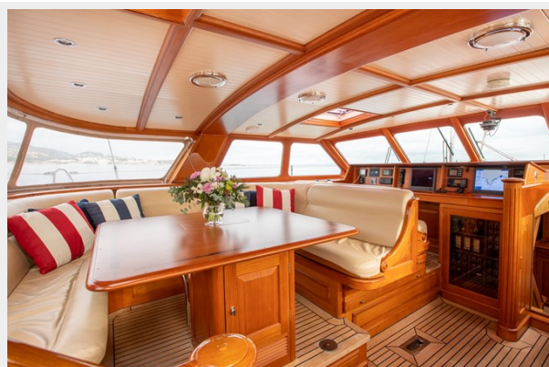
Pilothouse and Navigation Area