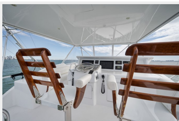
(2) Teak Murray Brothers Helm Seats