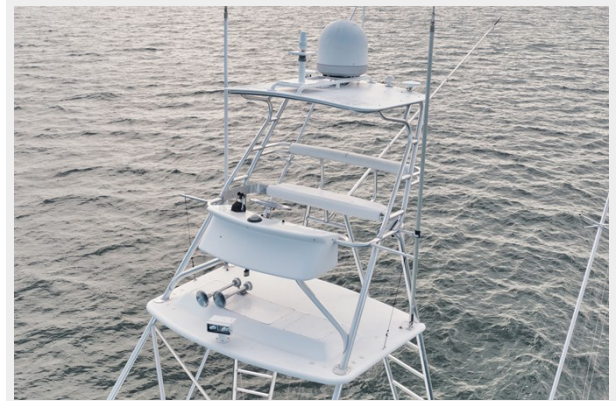
Tower and Tower Helm