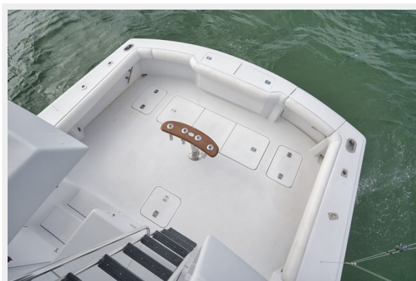
Looking at Cockpit from Flybridge