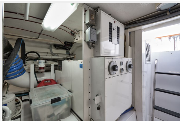
DC Switches and Generator On-Off Switches