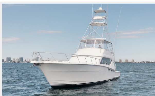
Port Bow Profile