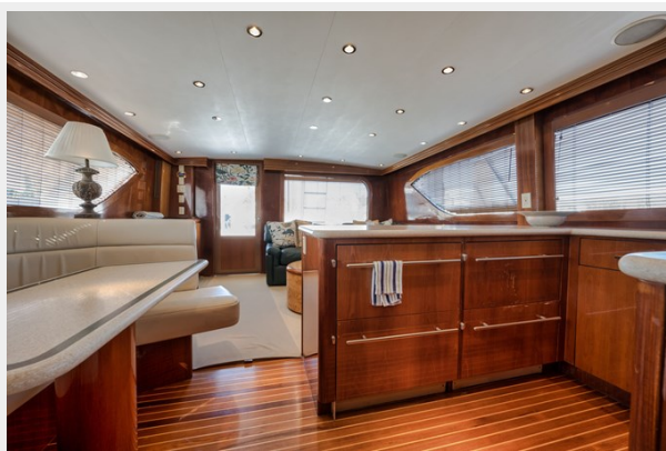
Teak and Holly Flooring