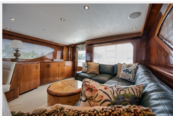
Salon Maple Interior, Blinds and Upholstered Valances