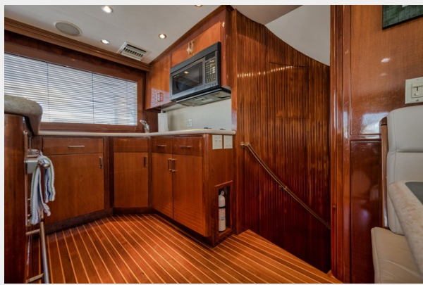
Galley Port Forward