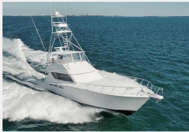
Starboard Bow Running View