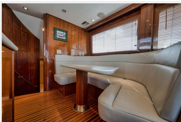
U-Shaped Ultra Leather Dinette, Reupholstered in 2017