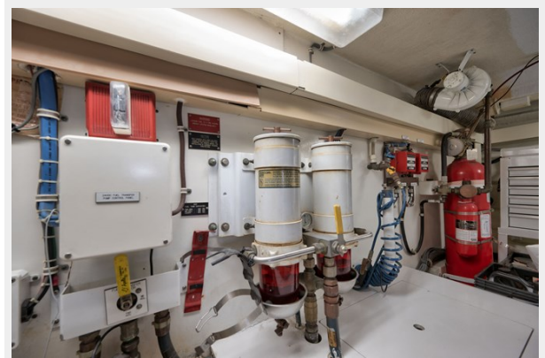
Engine Room to Starboard