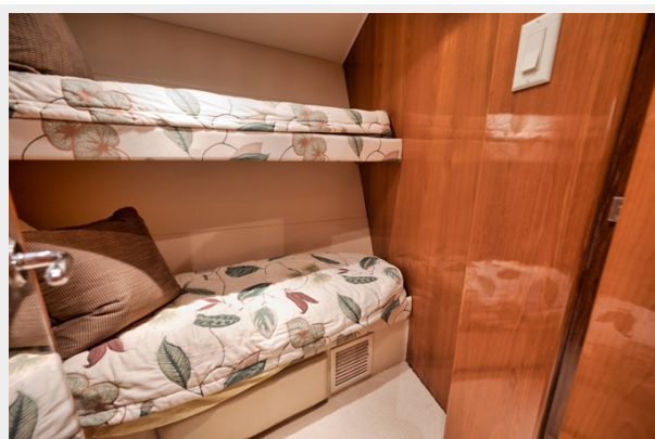
Guest Stateroom Starboard