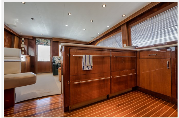
(2) Subzero Under Counter Refrigerator and (2) Subzero Under Counter Freezers