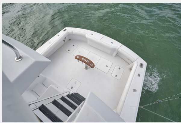
Cockpit View from Tower