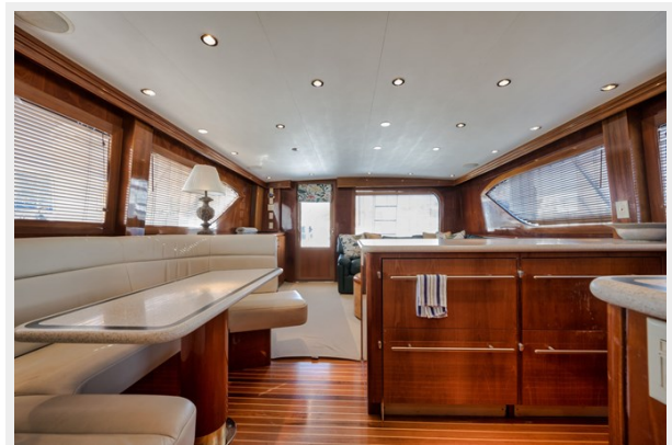
Dinette and Galley Looking Aft