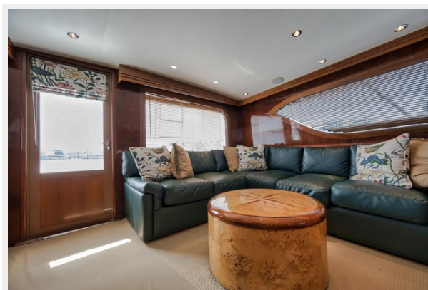
Salon L-Shaped Leather Sofa, Reupholstered 2017