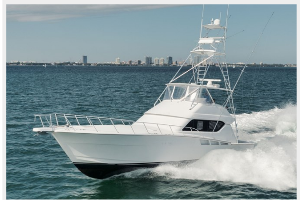
Port Bow Running View