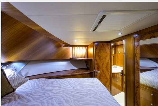
Forward Guest Stateroom