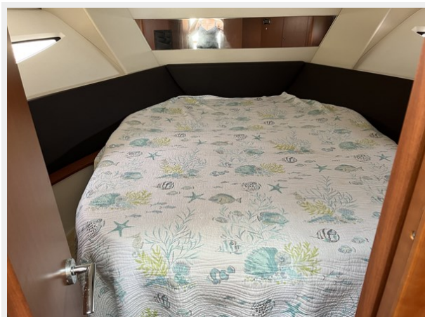
13. Owner's Cabin