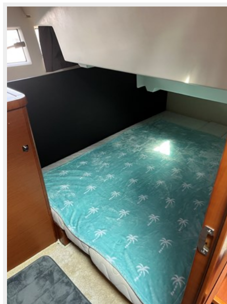
14. Second Cabin