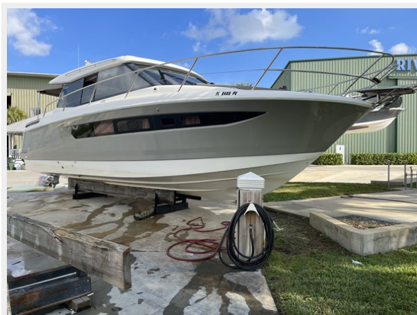
01. STBR HULL FWD