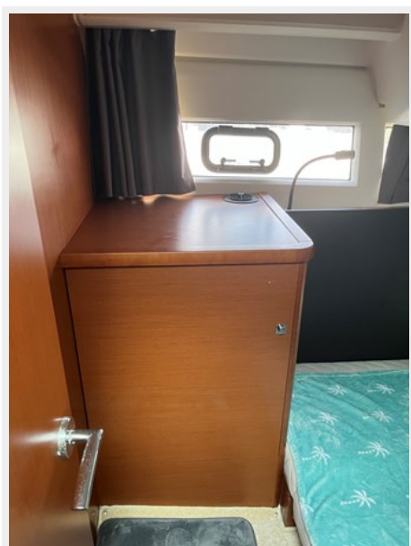
15. Large Hanging Locker In Second Cabin