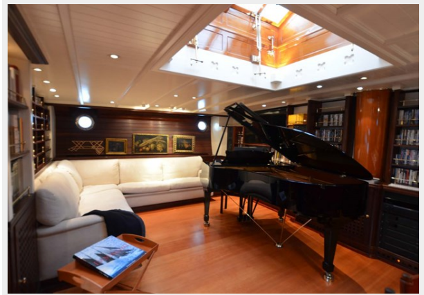
Lower deck saloon