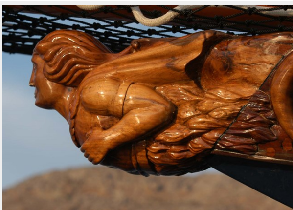
Decoration detail of SHENANDOAH OF SARK