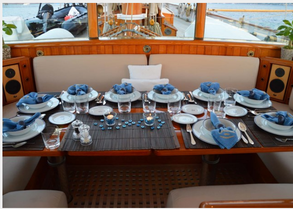
Main deck exterior dining area