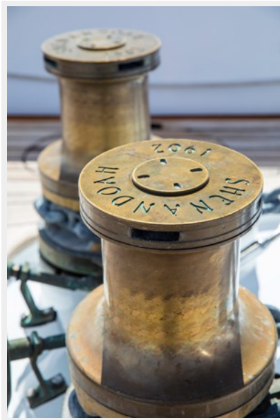
Decoration detail of SHENANDOAH OF SARK