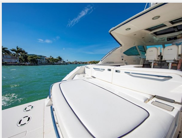
Aft Sunpad with Barn Style Doors 1