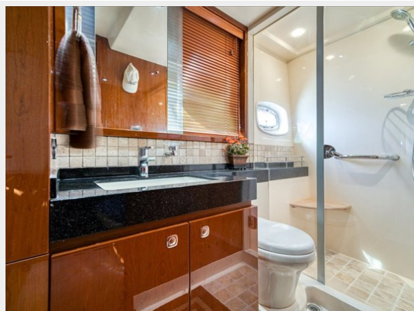
Ensuite Master Head 1