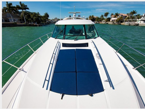
Bow and Sunpad 2