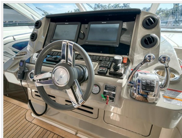
Cockpit Helm 3