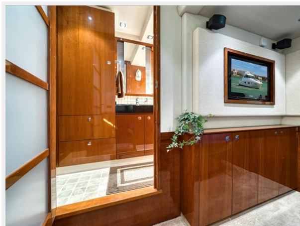
Bow VIP Stateroom and Ensuite Head 2