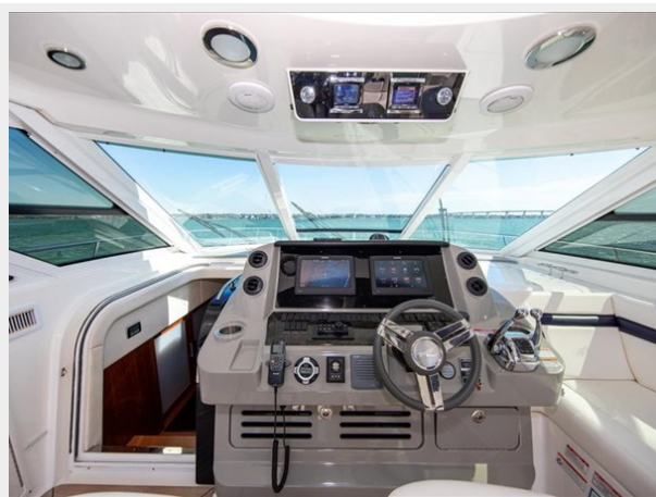
Cockpit Helm 2