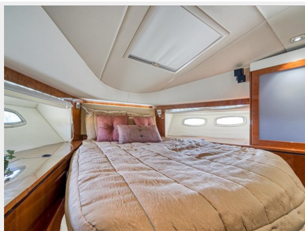
Bow VIP Stateroom 2