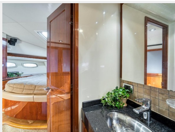
Bow VIP Stateroom and Ensuite Head 1