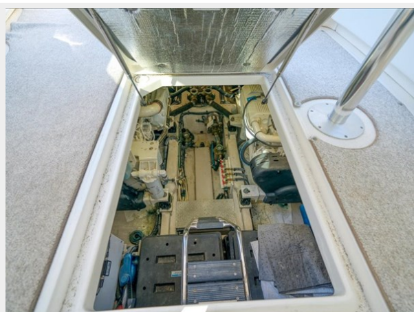
Engine Room 1