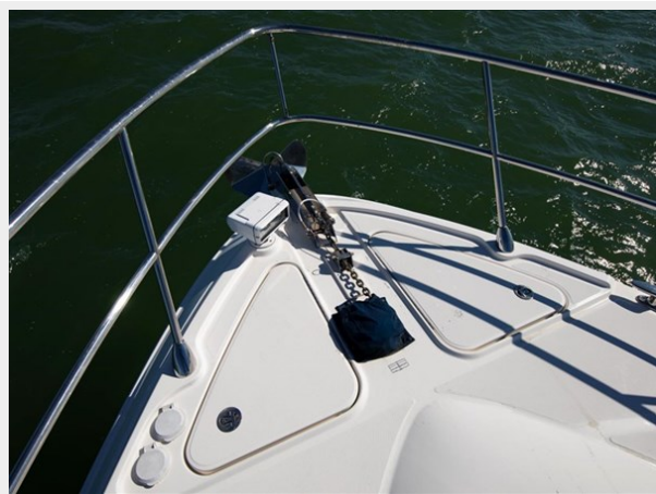
Bow and Anchor 1