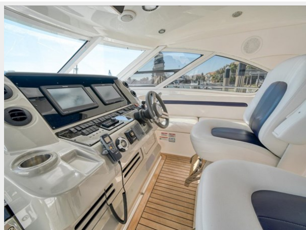
Cockpit Helm 4