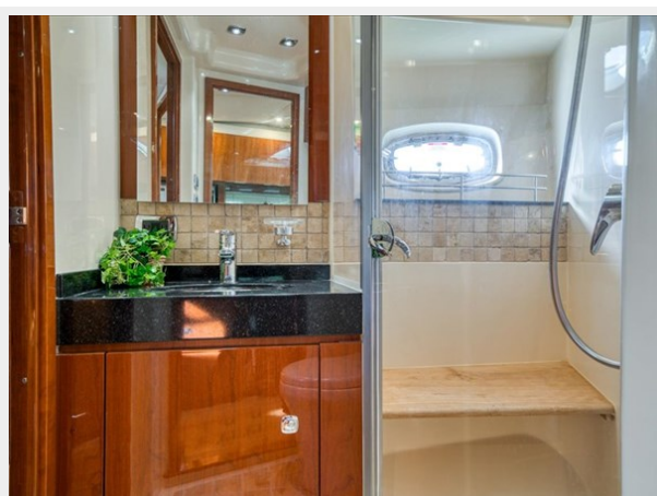
Ensuite Master Head 3