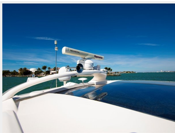
Raymarine Electronics/ Radar 2