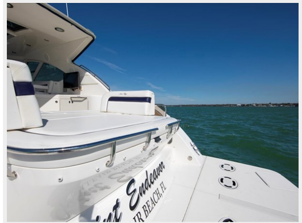
Transom and Aft Sunpad 1