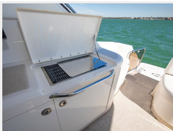
Cockpit Kenyon Electric Grill Cockpit Kenyon Electric Grill