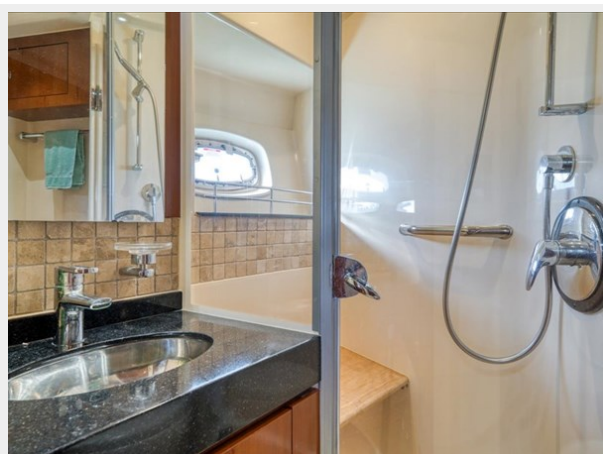
Bow and Guest Day Head 1