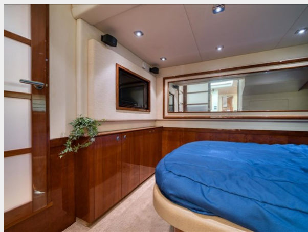
Master Stateroom 4