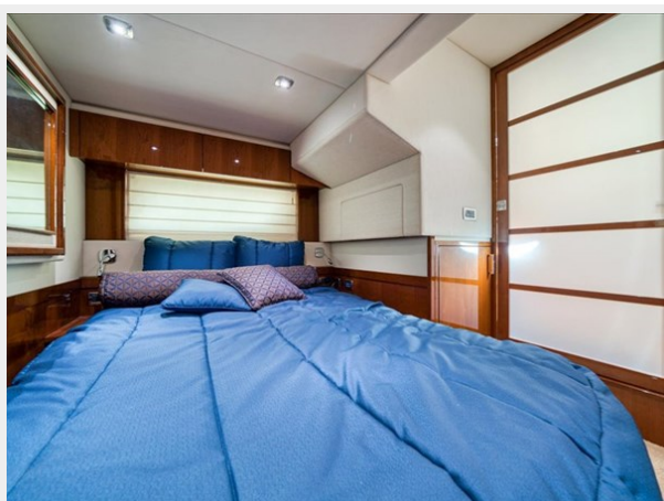
Master Stateroom 2