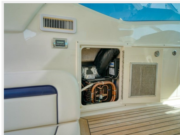
Cockpit Corsair Air Conditioner