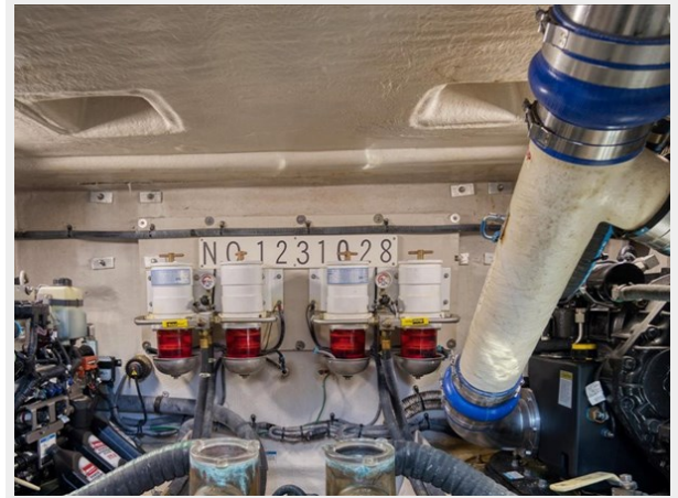
Engine Room 4