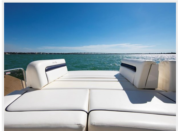
Aft Sunpad with Barn Style Doors 2