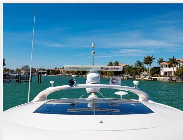
Raymarine Electronics/ Radar 1