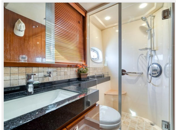
Ensuite Master Head 2