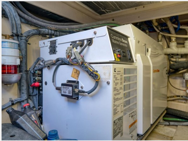
Engine Room 3