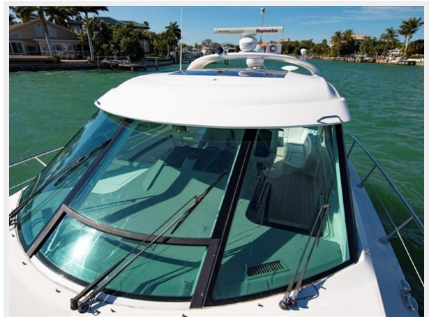
Bow Windshield 1