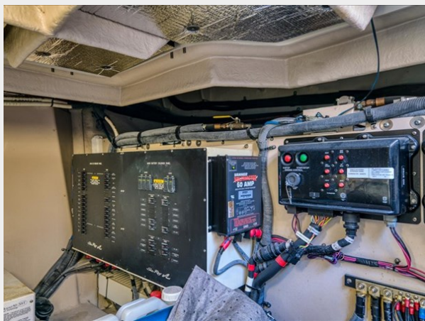
Engine Room 5