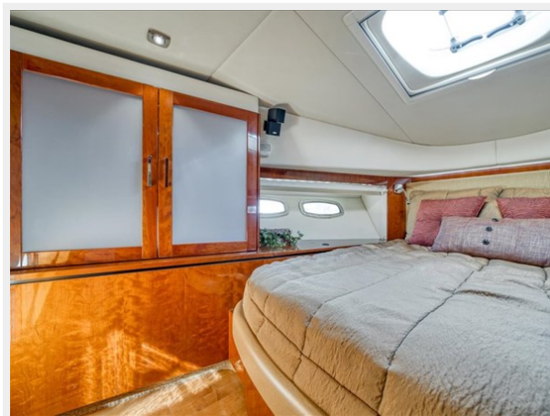
Bow VIP Stateroom 3