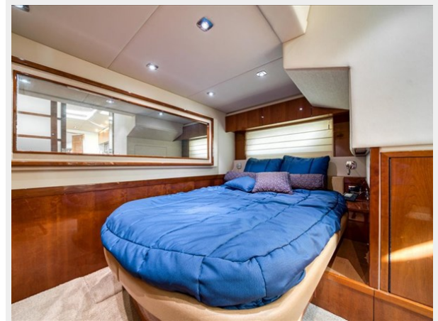
Master Stateroom 1