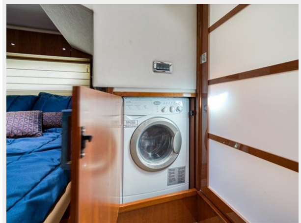
Master Stateroom Washer and Dryer