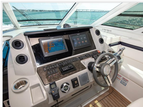
Cockpit Helm 5