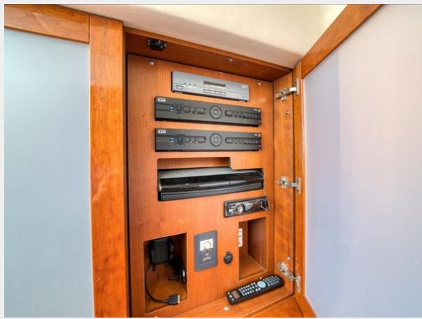
Salon Control Panel 1