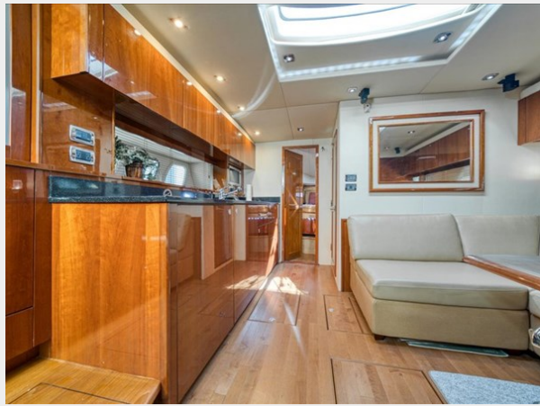
Salon/ Galley 1