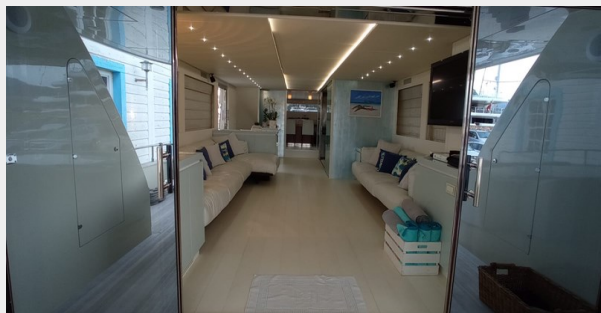
LARGE LIVING ROOM WITH TWO SOFAS