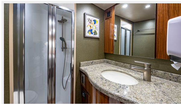
Owner's Stateroom Ensuite