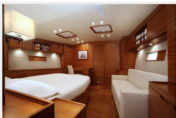
SWS 100 ACAIA FOUR 040 2.1_ridimensionare