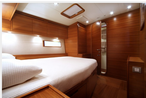
SWS 100 ACAIA FOUR 097_ridimensionare