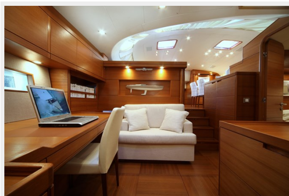
SWS 100 ACAIA FOUR 121_ridimensionare