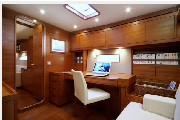
SWS 100 ACAIA FOUR 104_ridimensionare