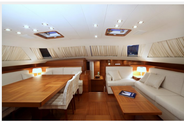
SWS 100 ACAIA FOUR 140_ridimensionare