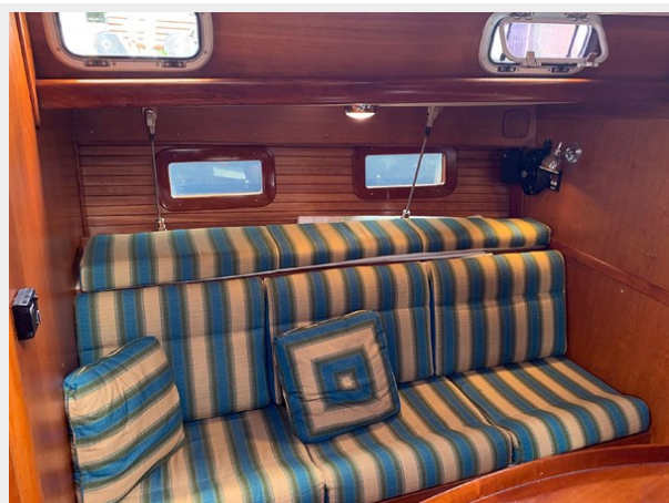
Main Salon, Port