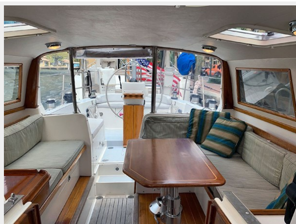
Pilothouse, Looking Aft