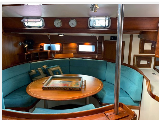
Main Salon, Stbd.