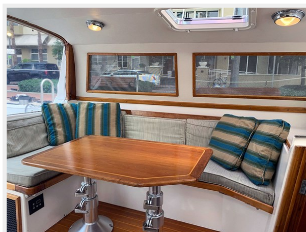
Pilothouse, Port Aft