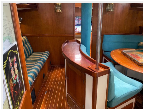
Main Salon Fwd.