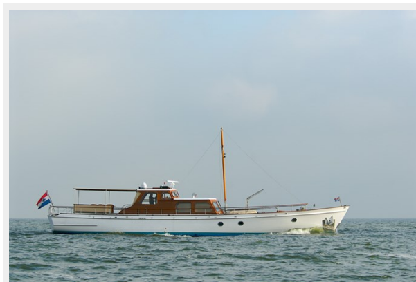
dsc_0970 - version 2