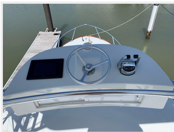
Tower helm with networked Garmin MFD