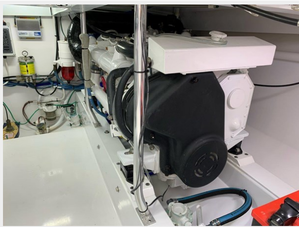
Port Cummins 370hp