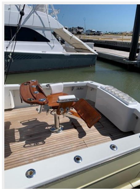
Release Fighting Chair with rocket launcher backrest