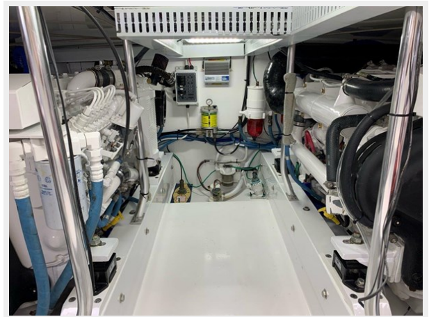
Strengthened engine mounting beds