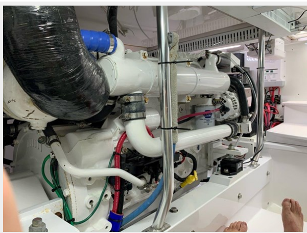
Detailed engine room