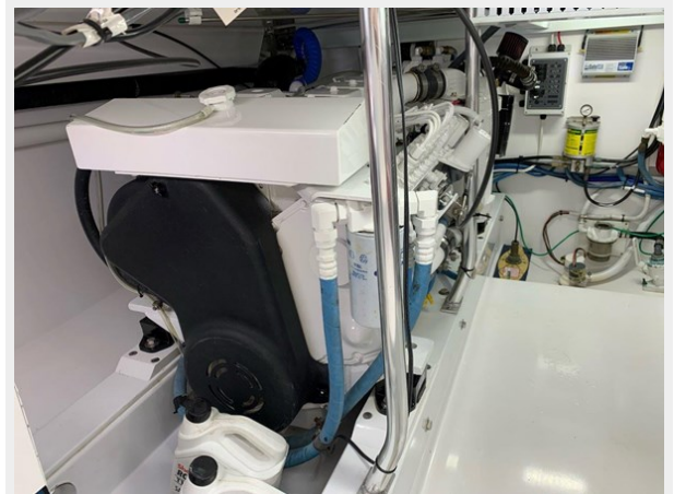
New CUMMINS mechanical motors 2016