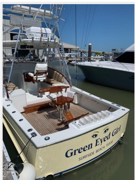
Teak cockpit deck